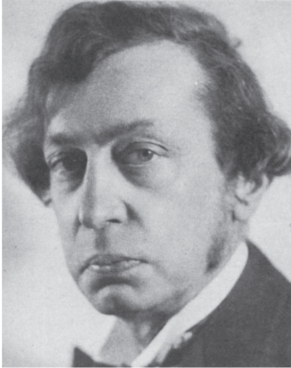
Karel Van de Woestijne ( 1878-1929)