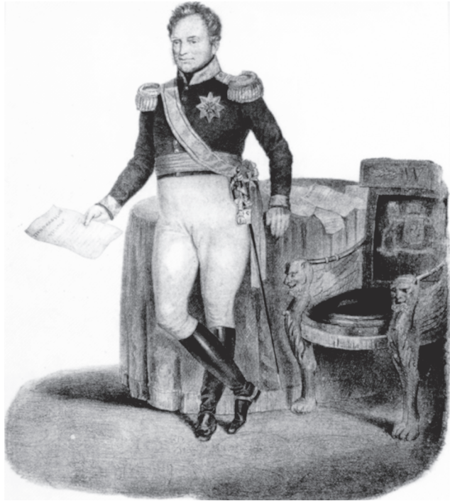
Willem I (1772-1843)