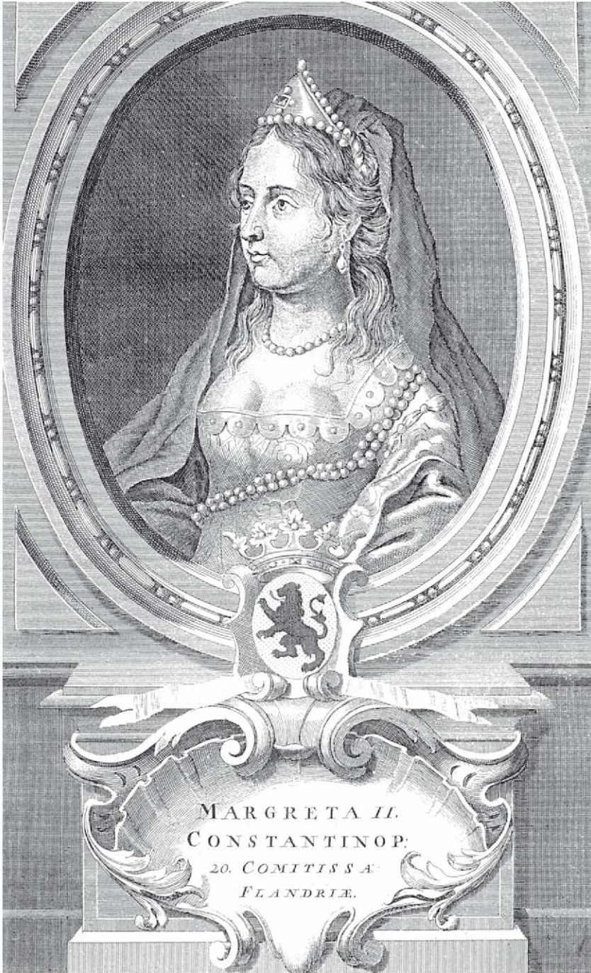
Margareta van Constantinopel 1202-1280