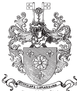
Blazon van de familie van Driessche