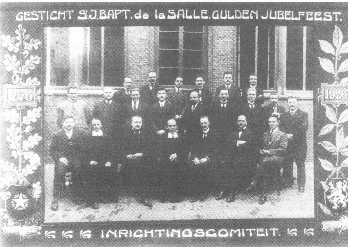
Gulden jubelfeest St.-Jan-Baptist de la Salle 1926; foto verz. E.Dekeyser, Gent.

1 2 3 4 5 6 7 8 9 10 11 12 13 14 15 16 17 18 19 20 21 22