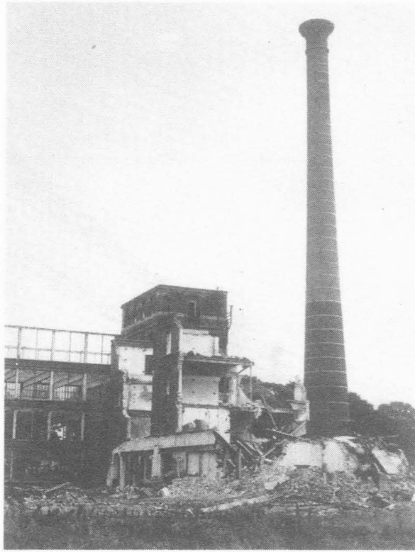
9.9.65. La Lys. De afbraak is volop bezig.