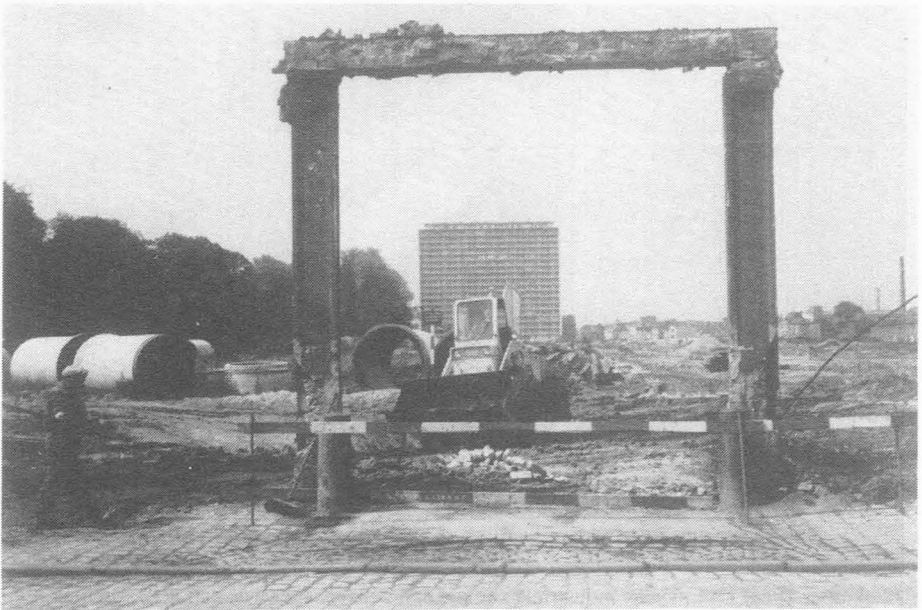
12.6.72. Ex. La Lys.