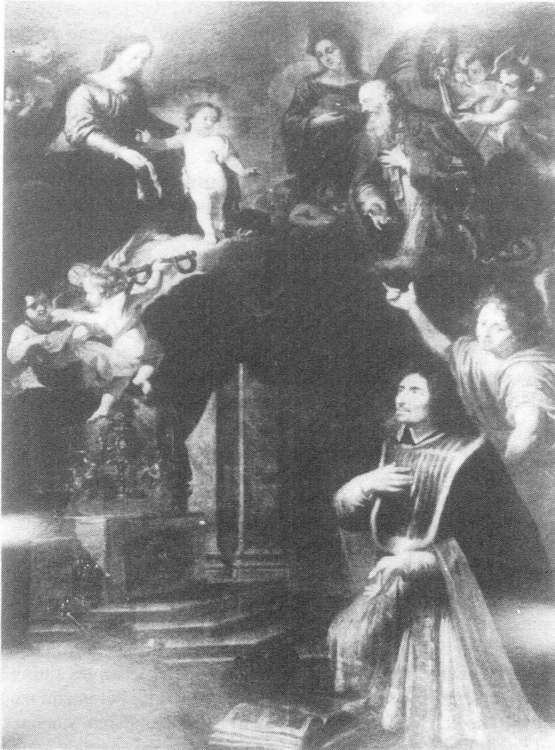
Afb. 1. O.L.Vrouw der Gewillige Slaven schenkt de boeien aan pastoor Nottingham. Tweede helft 17de eeuw. Doek 268 x 187 cm in de Sint-Niklaaskerk.

Roger Nottingham werd er Magister Artium 5 en volgens zijn eigen getuigenis ook baccalaureus formatus in de Theologie 6 . Het baccalaureaat kende toen drie graden: baccalaureus cursor of biblicus, sententiarius en formatus. Vanaf 1600 bedroeg de studieduur daarvan drie jaar 7 .