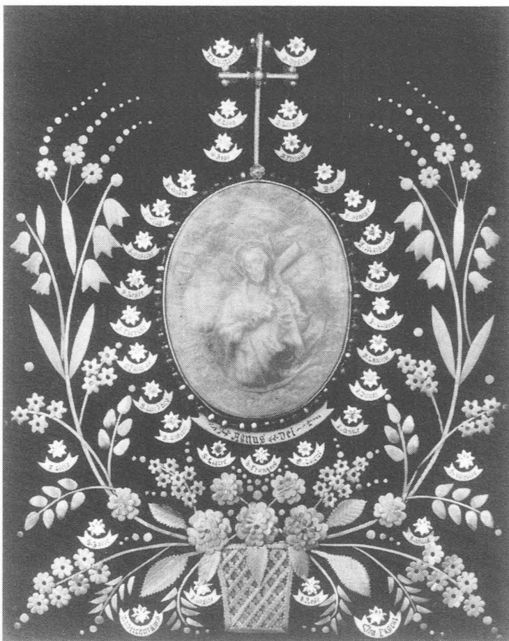
Agnus Dei uit 1929.

Het Agnus Dei van mijn grootouders De Keyser-Soenen is rijkelijk versierd met zilveren parels rond het medaillon en fijn gepreegde en secuur uitgesneden bloempjes en blaadjes uit haverstroo en werd op zwarte velours bevestigd.