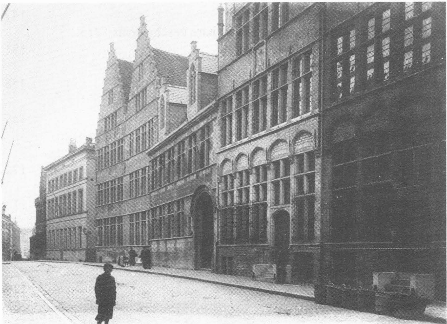
Links, de Kleine Sikkel onder een pleisterlaag.

Men moet reeds een paar landen hebben afgereisd om een gelijkwaardig kader en een even zeldzame aaneenrijging van oude monumenten te kunnen aantreffen.