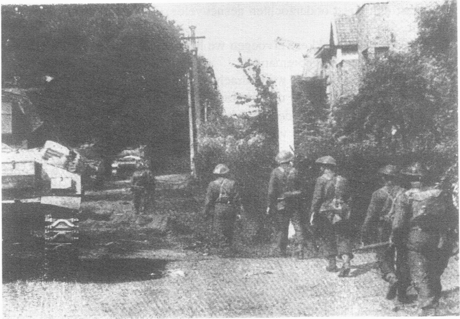
8. Mariakerke, Eeklostraat 13/09/44. De tankaanval werd samen met eenheden van het 9 e infanteriebataljon uitgevoerd.

daar waren we weer weg naar de Duitse linies. Bij onze aankomst in de vuurlijn worden we echter afgelost.