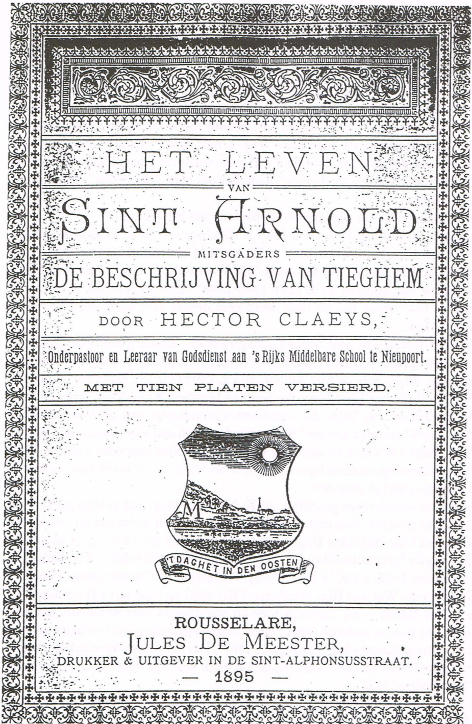
Fig. 3. Het Leven van Sint Arnold mitsgaders De Beschrijving van Tieghem door Hector Claeys, met tien platen versierd. Rousselare, Jules De Meester, Drukker & Uitgever in de Sint-Alphonsusstraat - 1895.