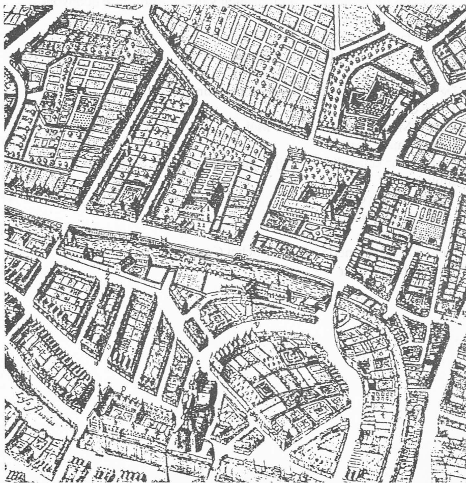
Fig. A. Oud Stadsplan van Gent waarop men bovenaan rechts de Peperstraat bemerkt.

Op het "Oud Stadsplan van Gent" ziet men bovenaan rechts de Peperstraat (Fig.A). Deze straat loopt van de Hoogstraat tot aan de hoek met de Burgstraat en deze met de Begijnengracht. Voorbij dit kruispunt kan men naar het Sint-Elisabethplein en de Begijnhofdries gaan waar in vroeger eeuwen het Sint-