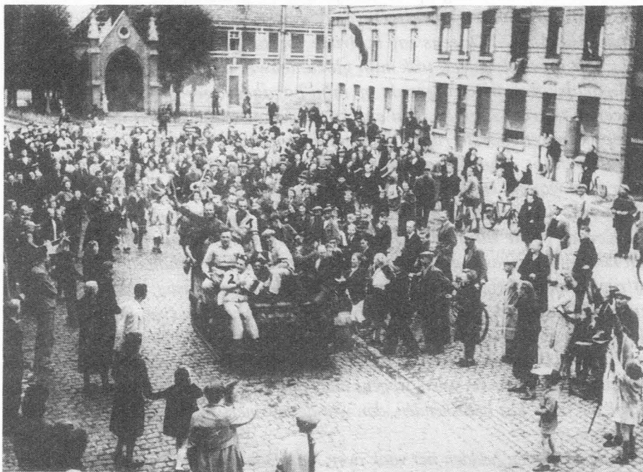
Bottelare, 5/09/44. Een van de Bren carriers op het Koning Albert I plein.