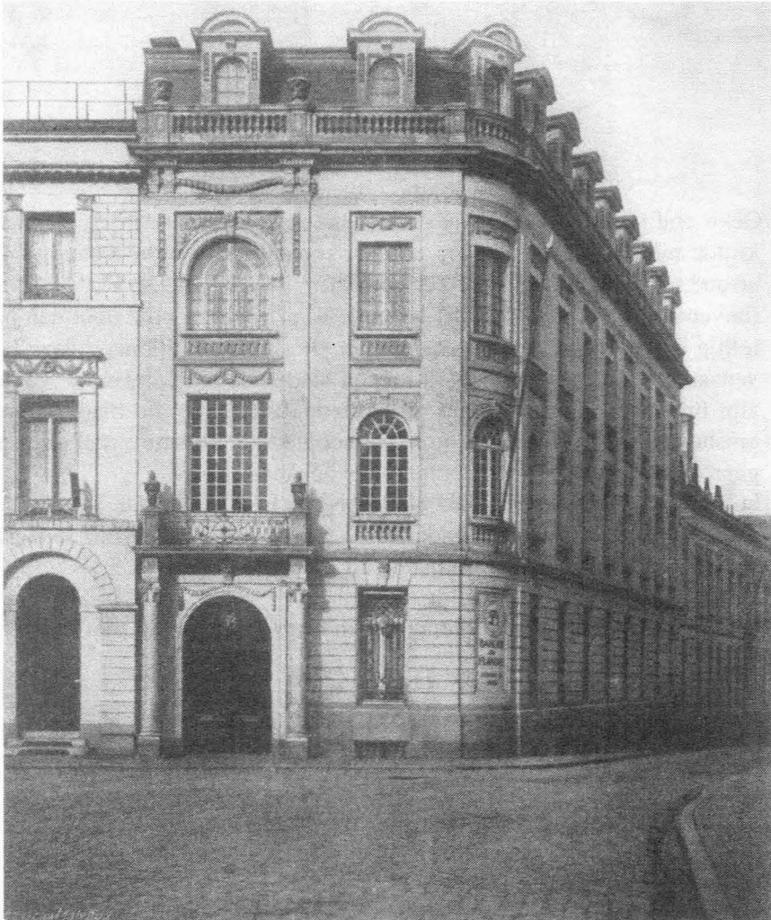
Het vernieuwd complex van de "Banque de Flandre"

In 1904 kocht de bank drie belendende woningen vooraan op de Kouter 26/ . In 1909 werd het geheel grondig verbouwd tot een complex met een totale gevelbreedte van 110 meter. Het hele interieur werd vernieuwd, ook dat van het Hotel De Draeck 27/ . De inhuldiging van de nieuwe gebouwen vond op 19 januari 1911 met veel luister plaats, onder meer met een diner in het Post-hotel op de Kouter.