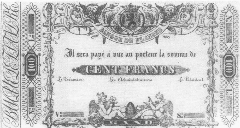
Banque de Flandre. Proefdruk van het biljet van 100 Frank

De “Banque de Flandre” gaf aanvankelijk eigen biljetten aan toonder uit. Deze werden in 1850 ingetrokken, na de oprichting van de Nationale Bank.