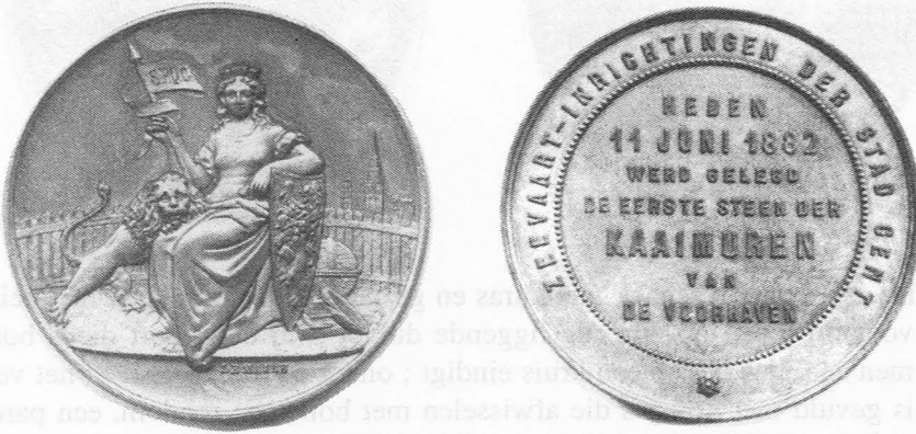
Herdenkingspenning van de stad Gent