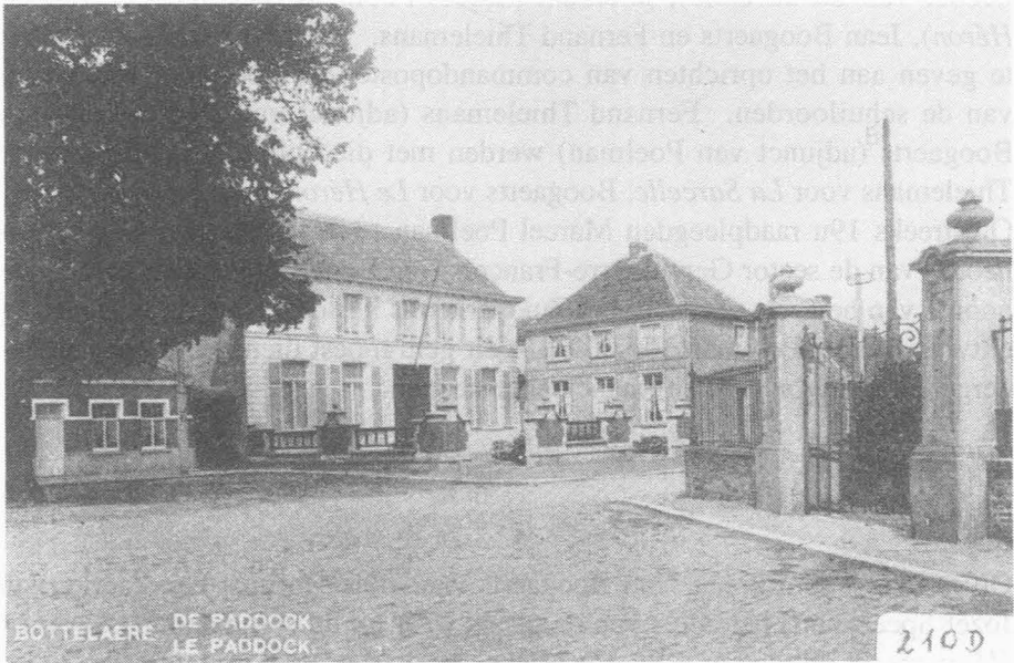
(Kopie P. Duportail)