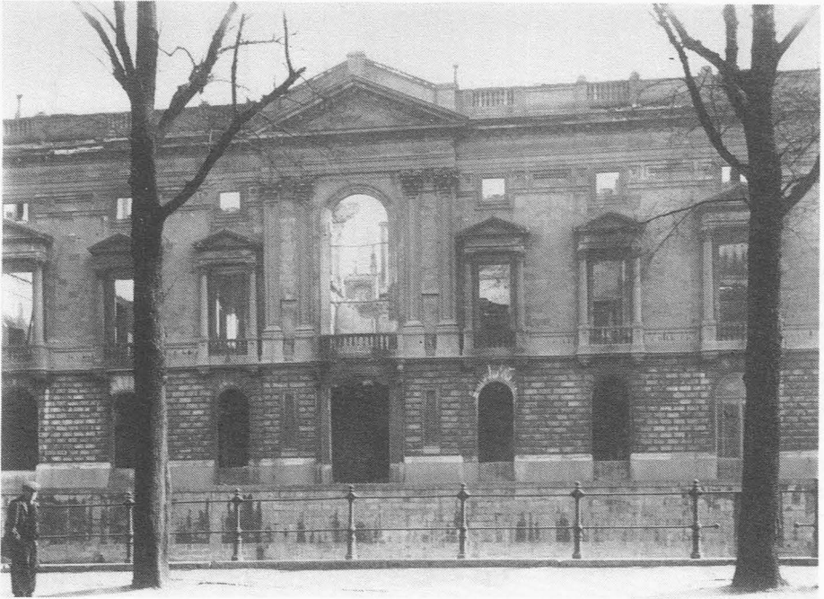
Na de brand van 19 maart 1926.