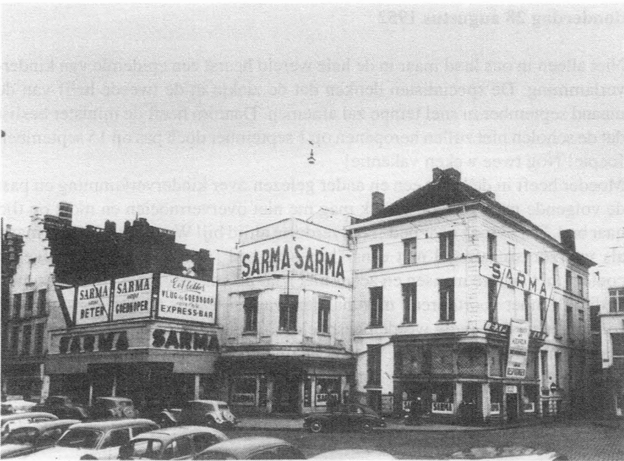
Het warenhuis Sarma op de Korenmarkt in de jaren vijftig.