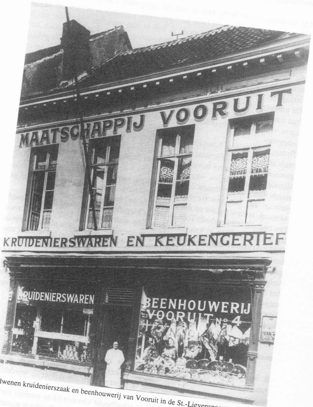
Verdwenen kruidenierszaak en beenhouwerij van Vooruit in de St.-Lievenspoortstraat.