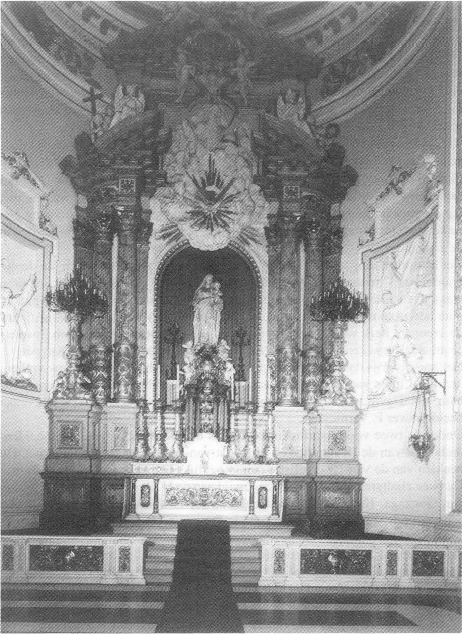
De Sint-Barbarakerk. Interieur.