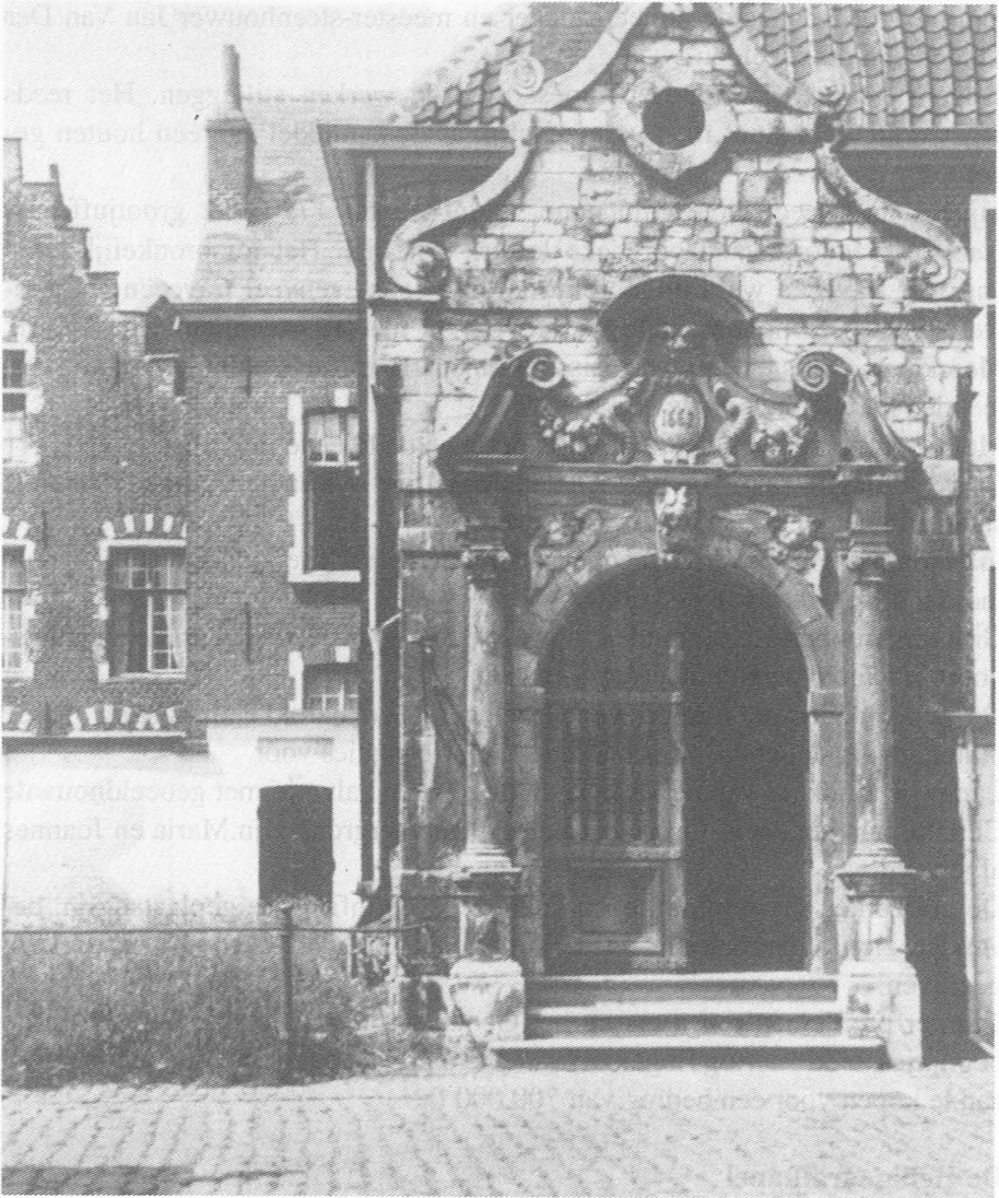
Afb. 2. De Heilig Grafkapel in het Klein Begijnhof.