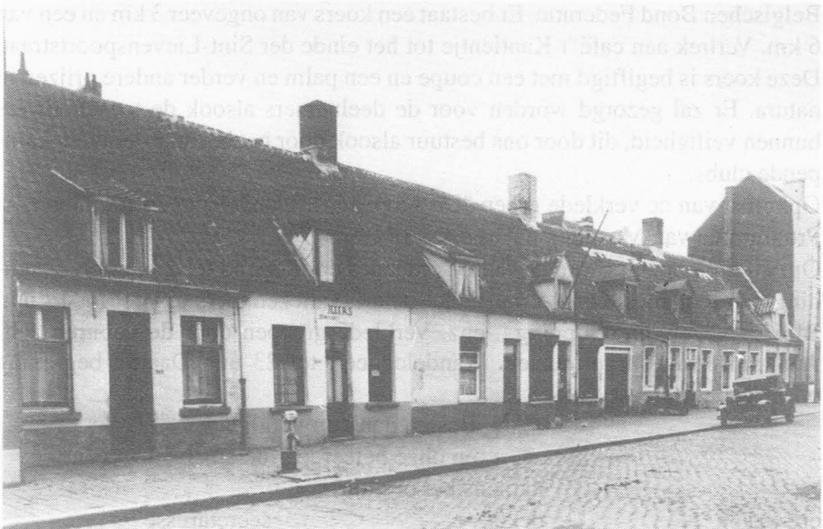
Verdwenen huizen in de St.-Lievenspoortstraat. Thans autoboxen.

De buurtfeesten van 1949 waren de laatste die in de Sint-Lievenspoortstraat werden georganiseerd. Voor het plotseling afbreken van die oude traditie zijn er verschillende redenen, of althans, doen er verschillende verhalen de ronde. Er zou in de straat meer een plagerige dan een echt vijandige tegenstrijdigheid zijn geweest tussen de Tsjeven (katholieken) enerzijds en de Sossen (socialisten) anderzijds, wat zich ook uitte tijdens de feestelijkheden. De radio-serenades gebeurden vanuit een bepaald lokaal. Iedereen had er de gelegenheid om