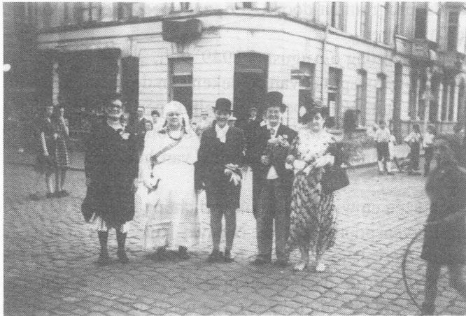
Groepje verklede bewoners van de straat tijdens de buurtfeesten van 1949. De foto is genomen op de hoek van de St.-Lievenspoortstraat en St.-Lievensdoorgang.

De buurtfeesten van 1949 waren de laatste die in de Sint-Lievenspoortstraat werden georganiseerd. Voor het plotseling afbreken van die oude traditie zijn er verschillende redenen, of althans, doen er verschillende verhalen de ronde. Er zou in de straat meer een plagerige dan een echt vijandige tegenstrijdigheid zijn geweest tussen de Tsjeven (katholieken) enerzijds en de Sossen (socialisten) anderzijds, wat zich ook uitte tijdens de feestelijkheden. De radio-serenades gebeurden vanuit een bepaald lokaal. Iedereen had er de gelegenheid om