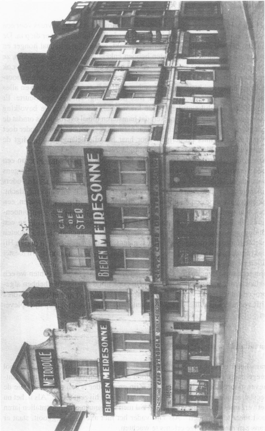
Café De Ster bij Melanie De Mulder, St.-Lieveispoortstraat 1.