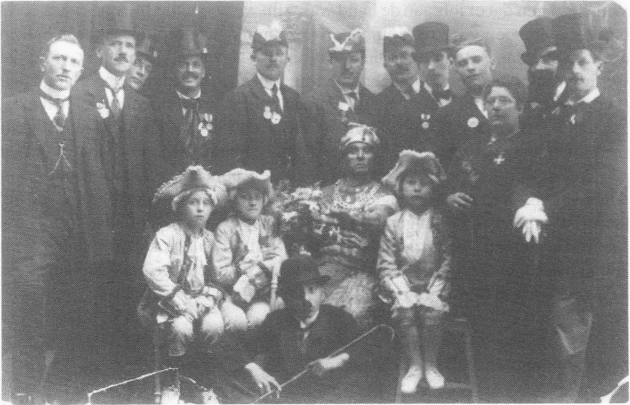
Het bestuur van de dekenij St.-Lievenspoortstraat, vergezeld van een verklede groep (midden jaren 1920).