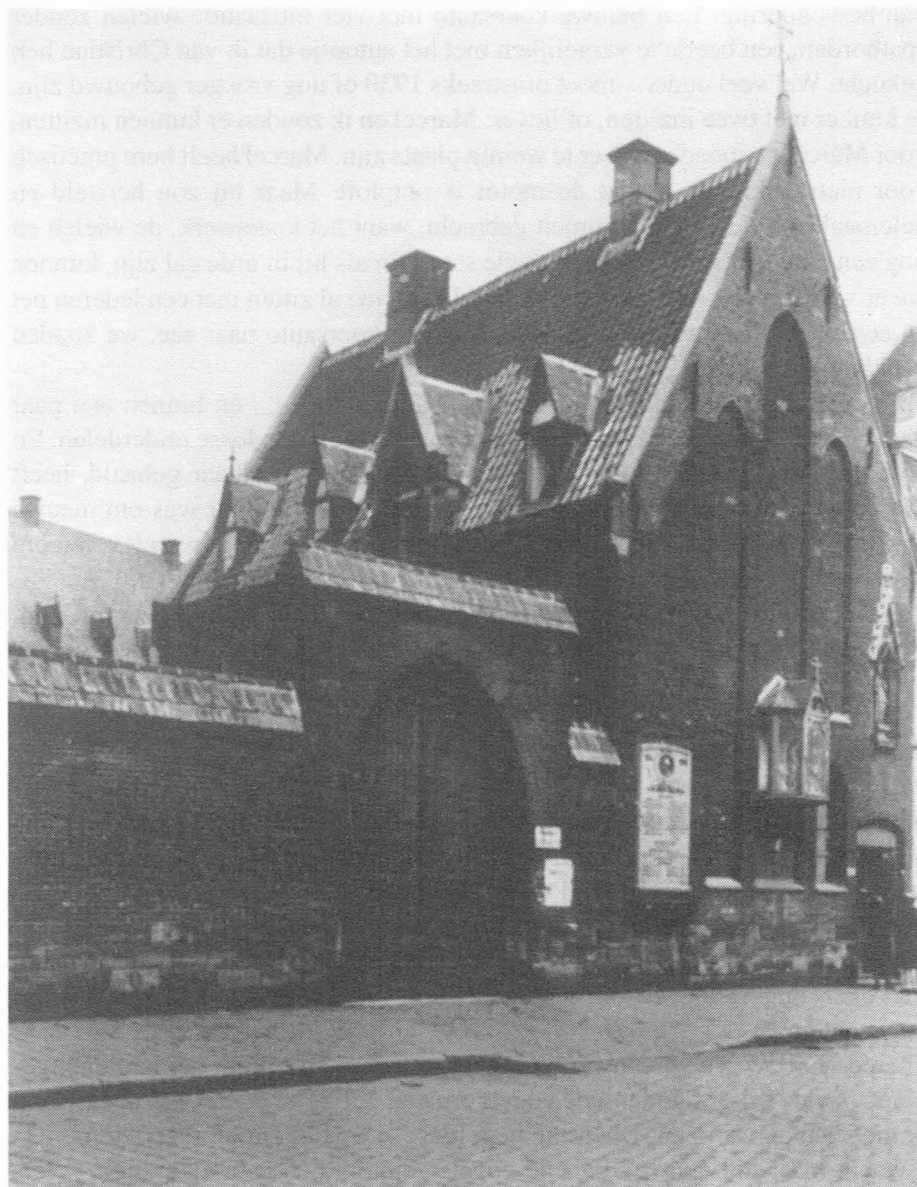
Het gesticht van de H. Aloysius van Gonzaga, thans Katholieke Hogeschool voor Gezondheidszorg, St.-Lievenspoortstraat 143.