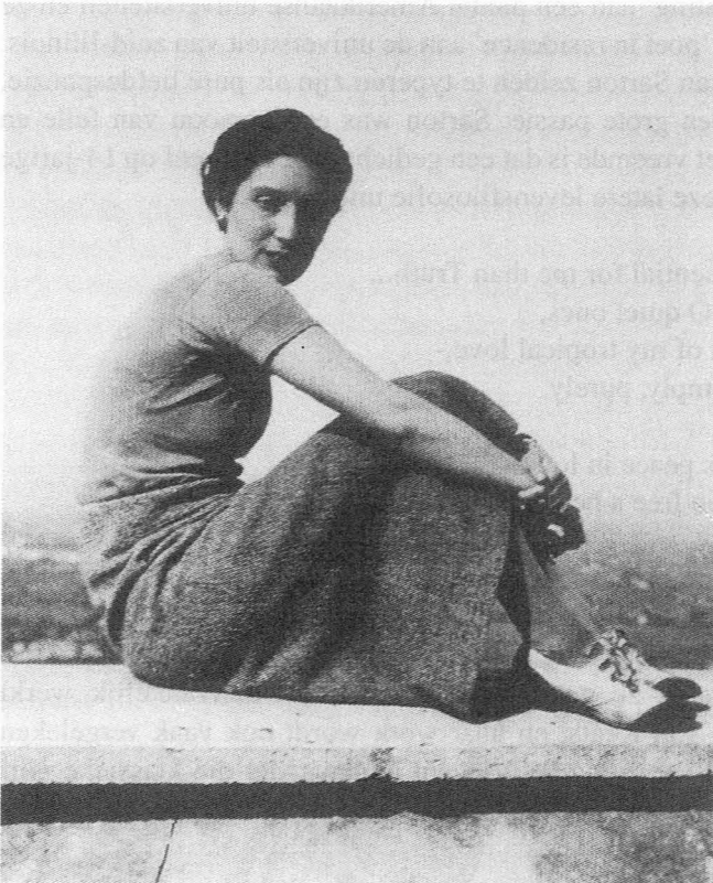
Fig. 2. De "jonge" May Sarton.

Het is moeilijk bij de beschrijving van May Sartons leven en werk niet in superlatieven te vervallen: in totaal verschenen 59 boeken van haar hand. Haar eerste gepubliceerde gedicht dateert uit 1930, haar laatste dagboek verscheen in 1995. Wat dat betreft evenaart ze dus de werkkraft en de gedrevenheid van haar vader. Bovendien had ze talenten op verschillende vlakken: ze schreef niet alleen poëzië, maar ook romans en ze had bovendien nog een korte toneelcarrière.