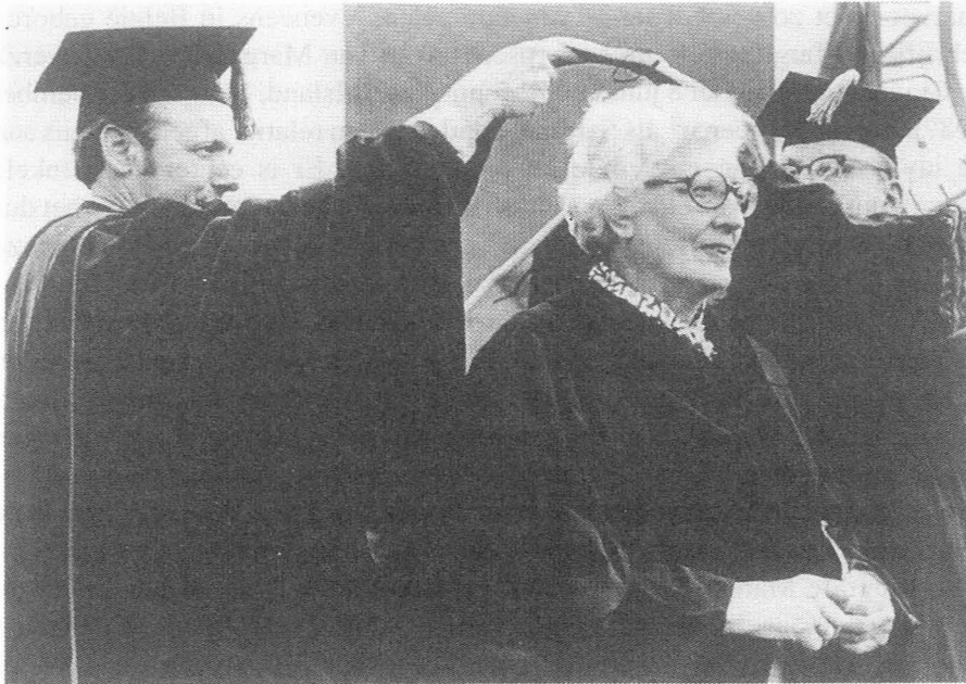
Fig. 3. May Sarton ontvangt een ere-doctoraat aan de universiteit van New Hampshire, 1976.

opvolging van hospitalisaties, een aantal hartaanvallen en uiteindelijk borstkanker. Die aftakeling beschreef ze ook nauwgezet in boeken als “After the Stroke”, “Endgame”, “At Eighty-Two” en “Recovering”. Die boeken werden druk gelezen, waarschijnlijk vooral door een wat ouder publiek, dat troost kon putten uit de directe en daardoor ook wel opbeurende stijl van Sartons beschrijvingen. Door de fysieke aftakeling wordt haar leefwereld steeds kleiner, en wordt ze steeds meer afhankelijk van de hulp van anderen: