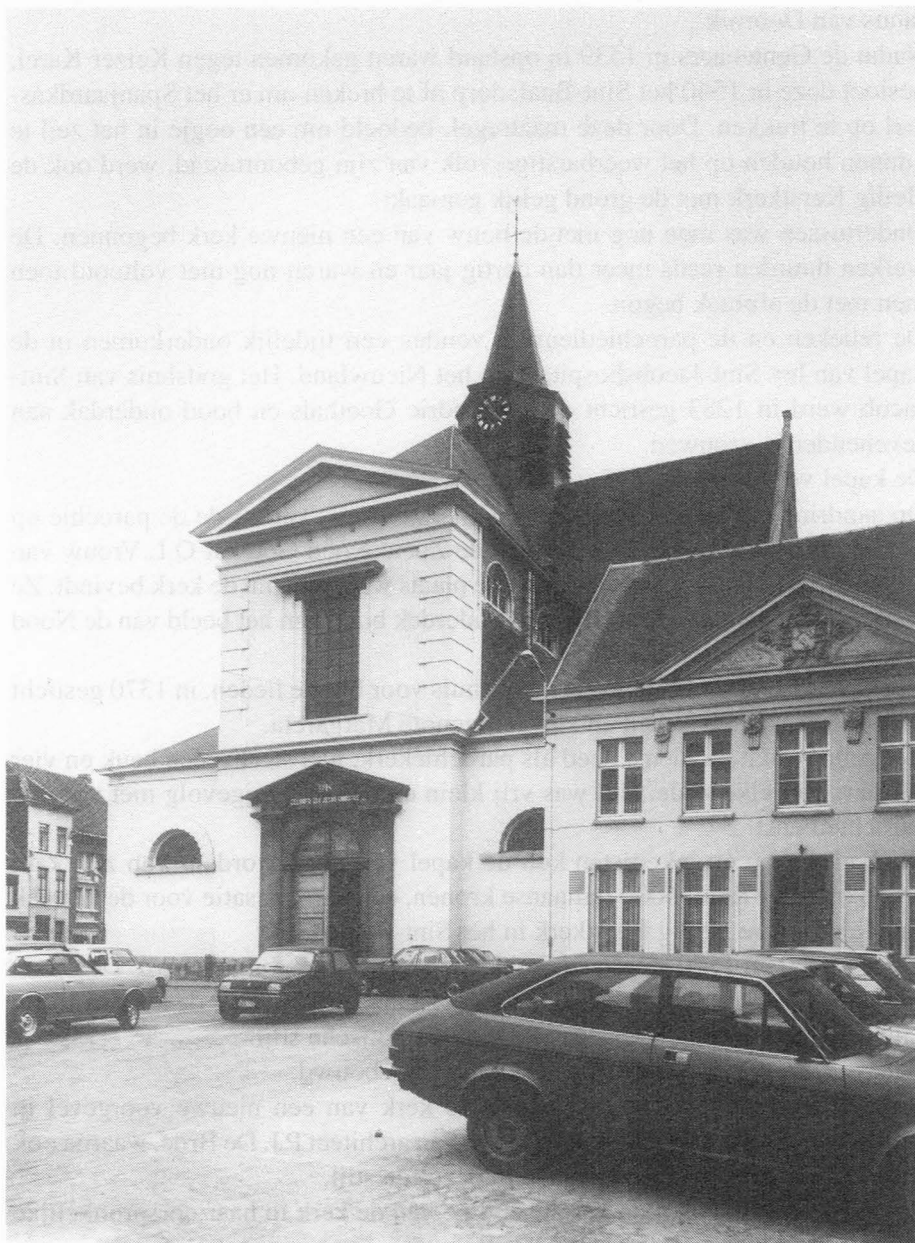
1. H. Kerstkerk.