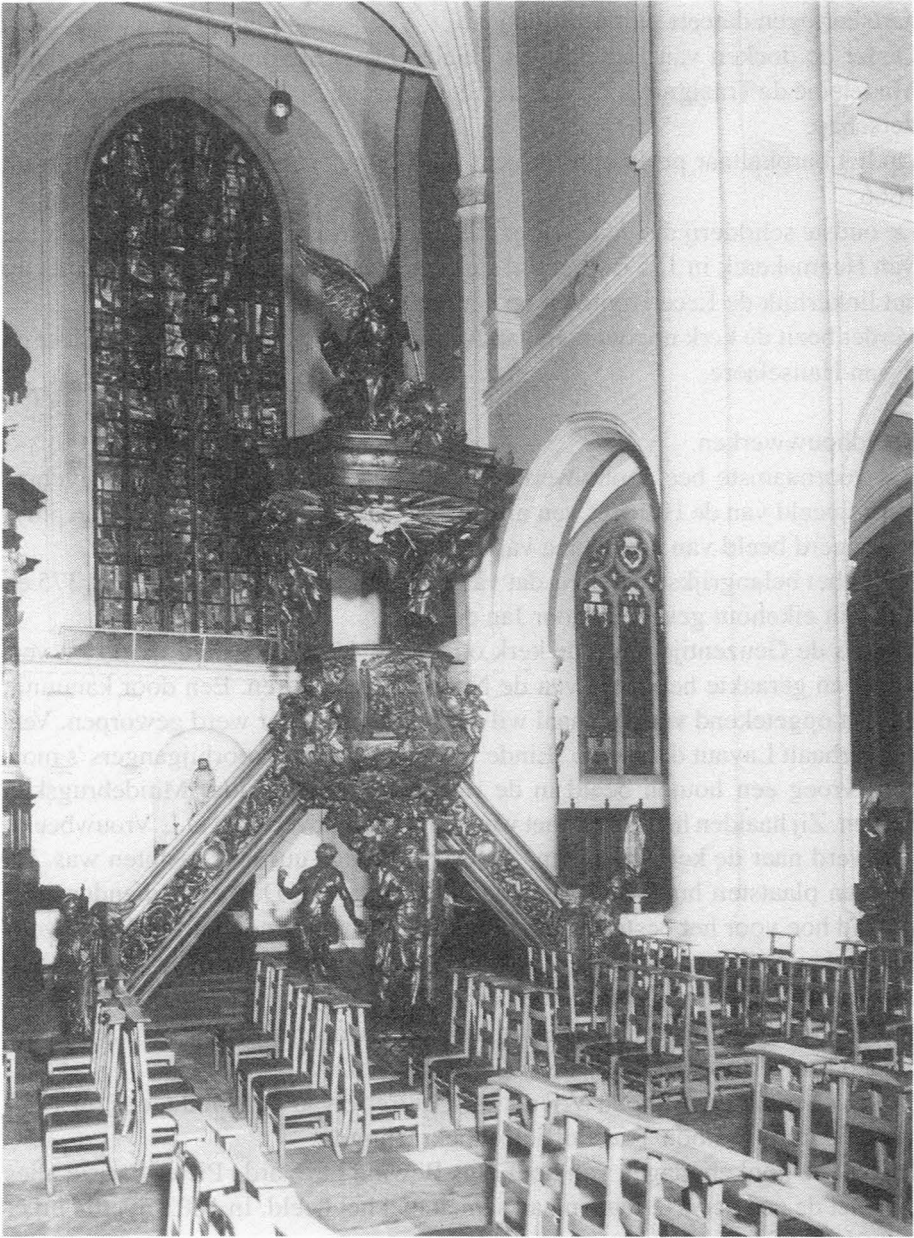
3. H. Kerstkerk. De preekstoel.