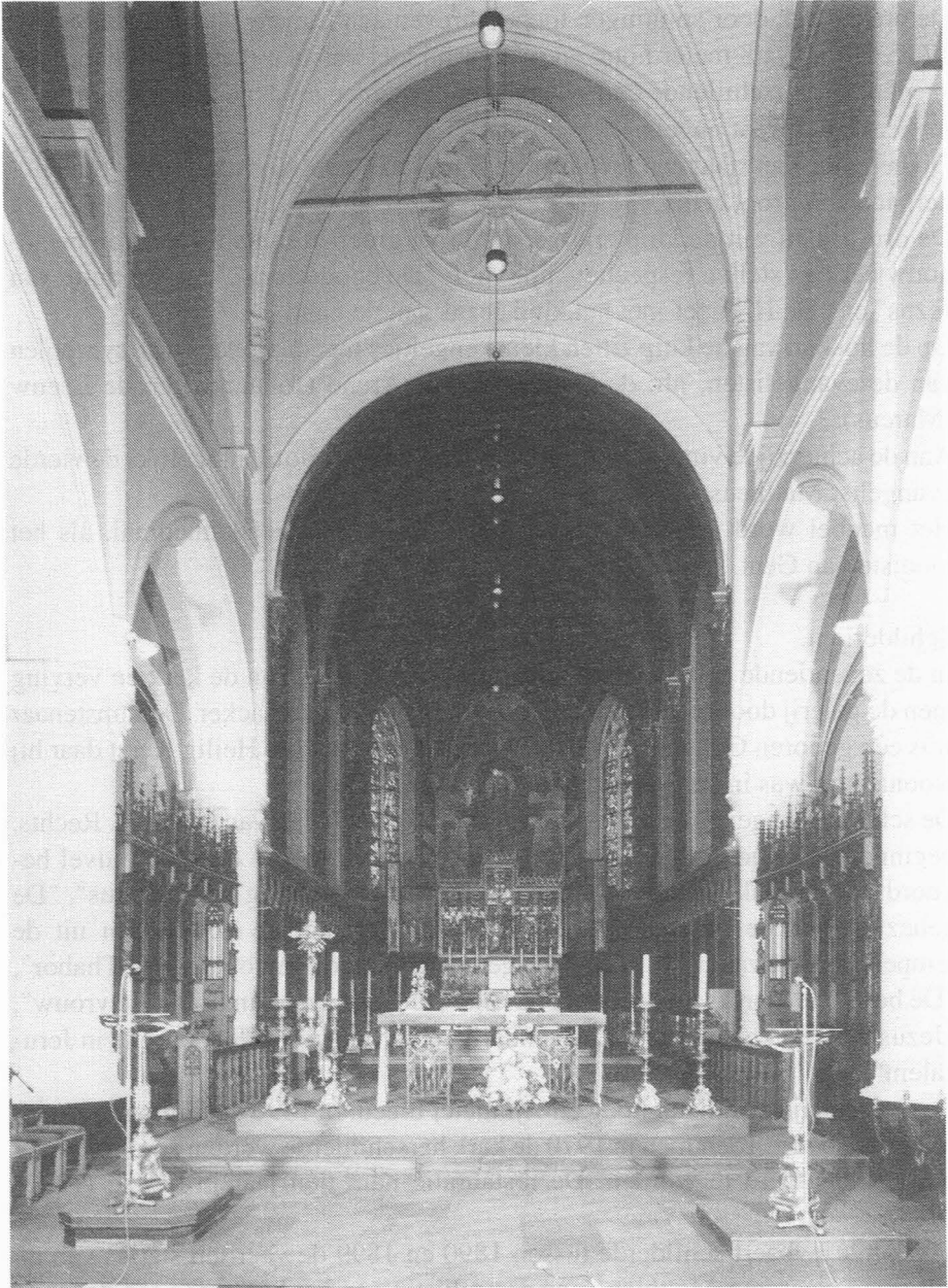
2. H. Kerstkerk. Interieur.