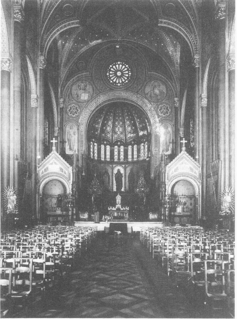
De St.-Annakerk. Interieur.