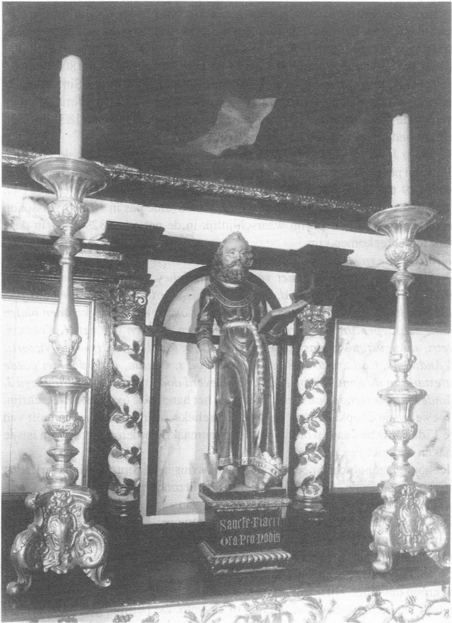
Gepolychromeerd houten beeld van de H. Fiacrius in de St-Martinuskerk te Gent.