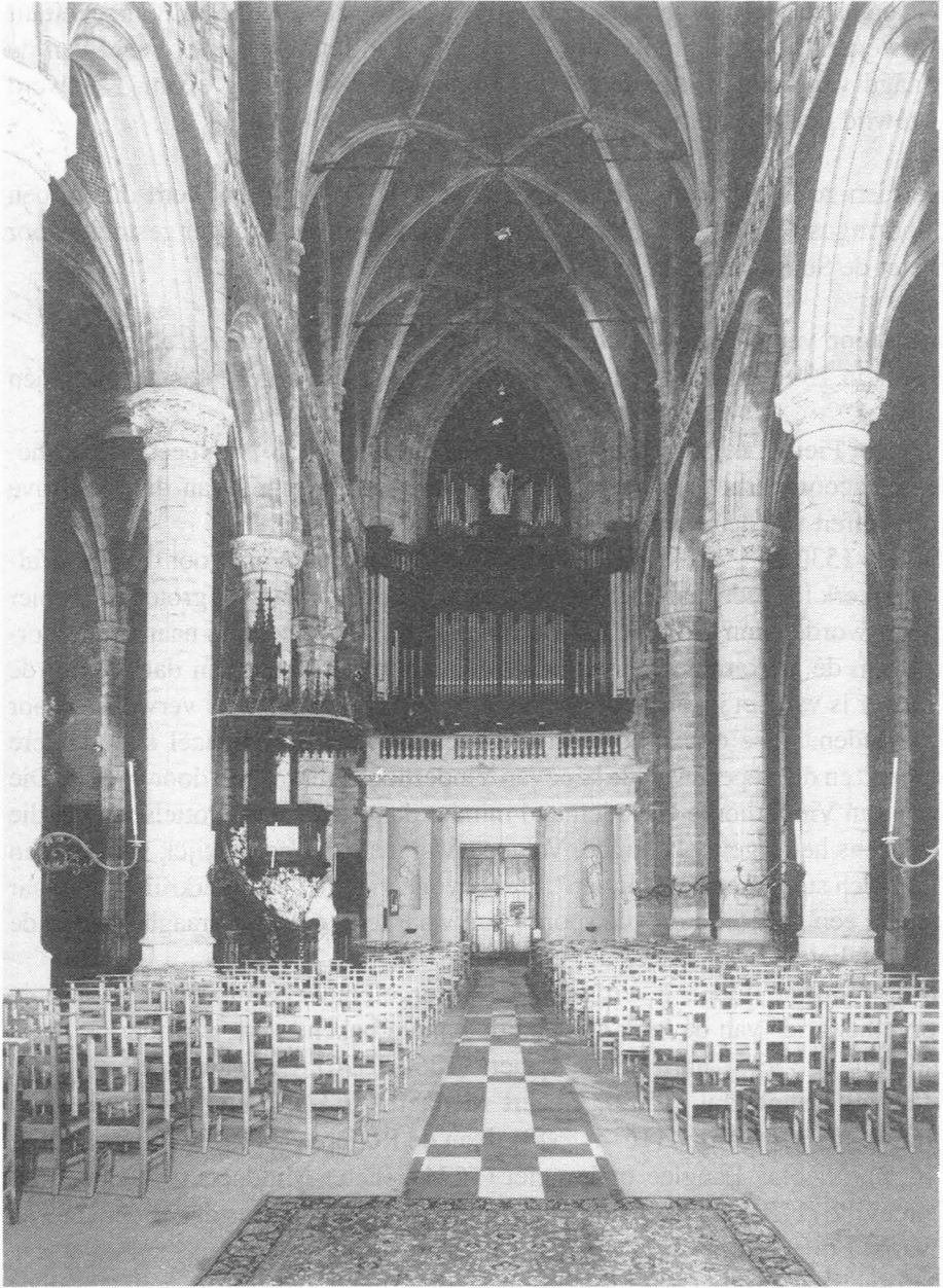
Orgel van de St.-Michielskerk.