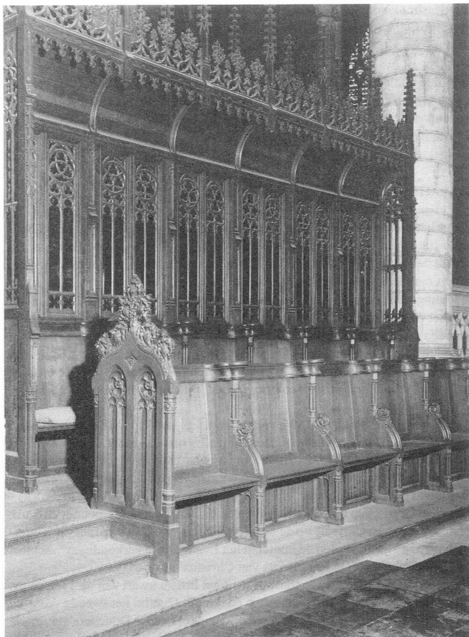
Koorgestoelte van de St.-Michielskerk.