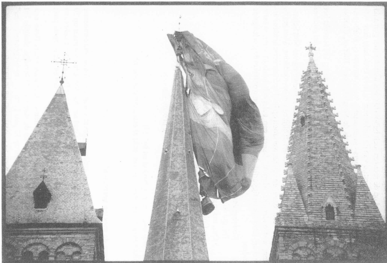
"De wind deed de ballon vervaarlijk tegen de wand van de torenspits van St.-Jacobs bengelen" schreef "De Gentenaar" op maandag 10 juni.