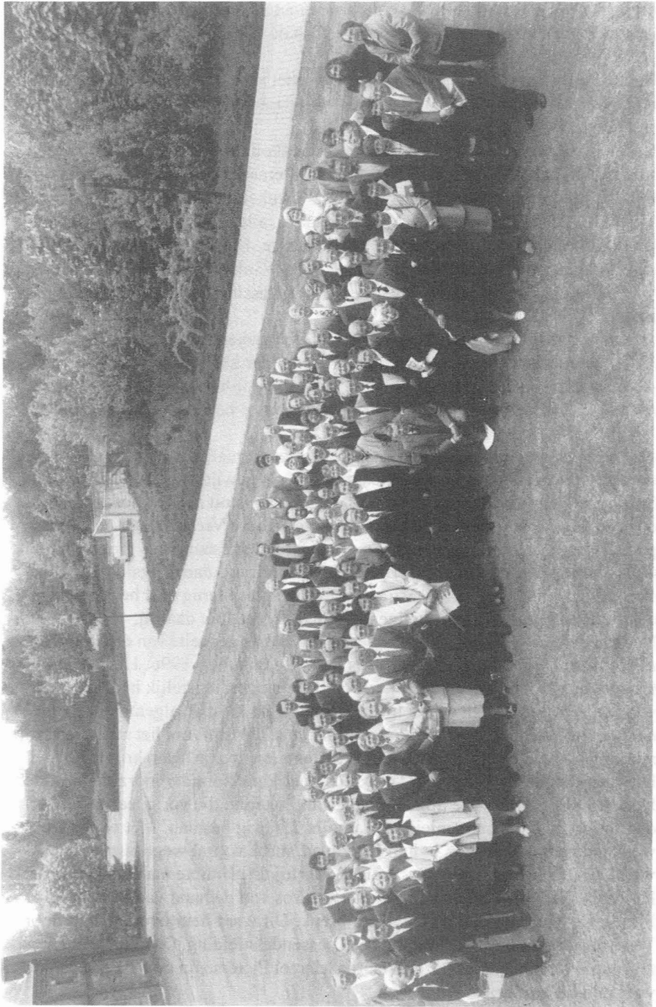
Deelnemers aan de 32e Gouwdag.