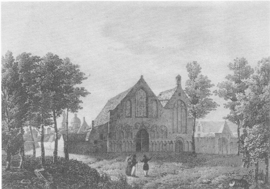
3. Het Hospitaal van de Bijloke.