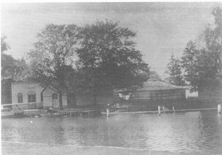
De "kabientjes van de Zwemscholen van Dossche" aan de Leie (1913).