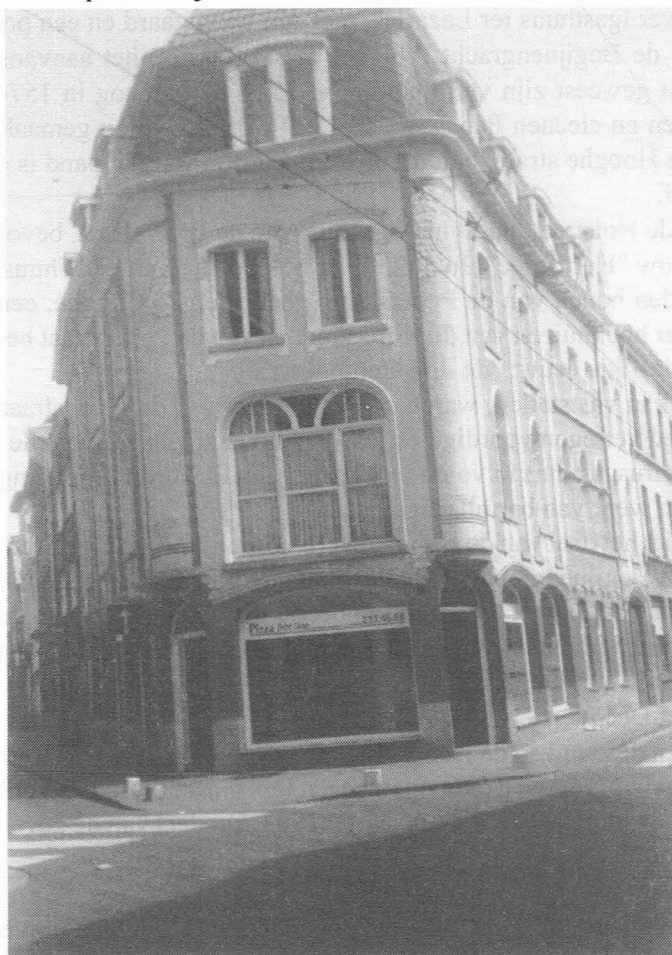
Fig. 26. Hoekhuis Begijnengracht-Hoogstraat nr. 162. Huis met Art Decoversieringen. Eigen foto, 1994.

Een aantal huizen en gevels, in het gedeelte van de straat dat we thans onder ogen nemen, dagtekenen uit de 19de eeuw. Het gaat veelal, maar niet uitsluitend, om bepleisterde en beschilderde gevels van drie bouwlagen waarvan een aantal gedecapeerd en sommige in de loop van deze eeuw verbouwd werden. Sommige van de panden zijn echter in wezen veel ouder, bezitten oude kernen,