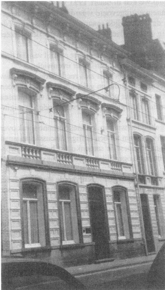
Fig. 28. Hoogstraat, huis nr. 102 en rechts nr. 100. Eigen foto, 1994.

Tussendoor nog een bemerking in verband met de nummering van de huizen. Zoals men reeds zal opgemerkt hebben, komen ook in dit deel van de Hoogstraat een aantal huizen voor die meerdere nummers dragen. Dit spruit natuurlijk voort uit het feit dat het gaat om gebouwen met verschillende en afzonderlijke appartementen. Juist daardoor wordt ook een vergelijking tussen de vroegere en huidige nummering bijzonder moeilijk.