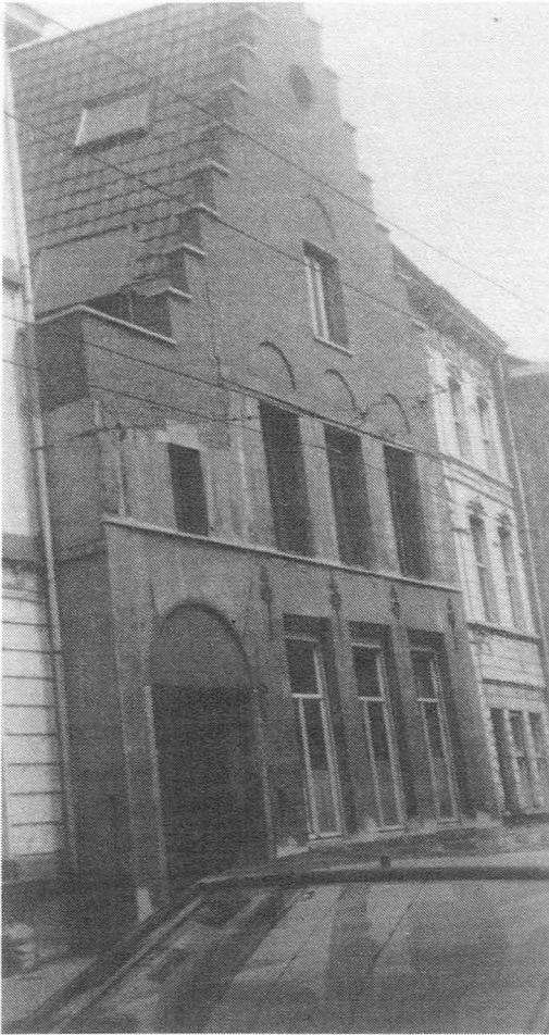
Fig. 29. Hoogstraat nr. 66. juli 1994.

We sluiten deze parenthesis en zetten onze tocht richting Peperstraat verder.