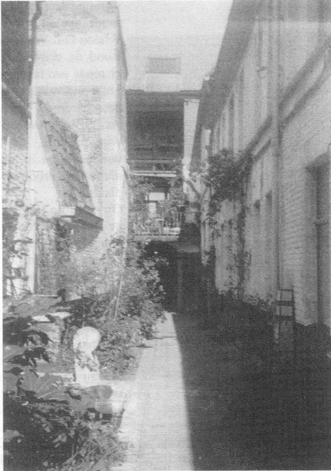
Fig. 24, Hoogstraat, de nrs. 129, 131-149, Beluik. juli 1994.

Akkerstraat en waarin studio's verhuurd worden. Aan de Westkant bevindt zich één pand, het nr. 149 dragend; het heeft verbouwingen ondergaan en kreeg een verdieping bij.