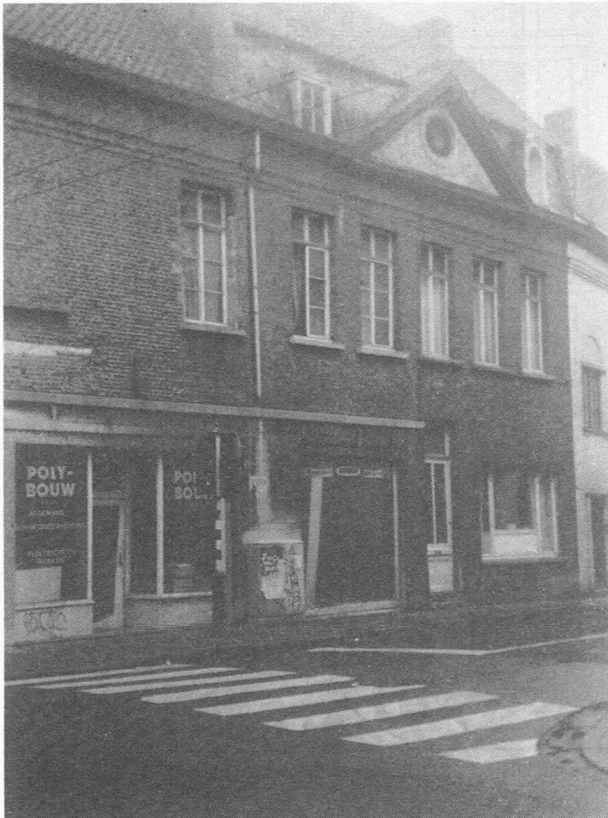
Fig. 31. Hoekhuis Hoogstraat - Peperstraat (kant Peperstraat). Eigen foto, 1994.

Het hoekhuis Hoogstraat-Peperstraat, waarvan we een deel (de kant aan de Hoogstraat) zien op de foto bij Fig. 30, vertoont een merkwaardigheid. Aan de kant van de Hoogstraat bezit het een puntgevel in baksteen en zandsteen van drie traveeën, onder zadeldak met pannen, die dagtekent van 1644. Aan de kant van de Peperstraat vertoont het pand een gevel die ontleisterd werd en samenvalt met een 18de-eeuwse eveneens ontleisterde gevel onder een driehoekig fronton. Steeds aan de kant van de Peperstraat stellen we vast, dat op het eerste