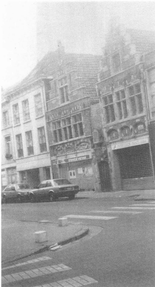
Fig. 25. Hoogstraat, pand nr. 161. Eigen foto 1994.

vormige deur en daarboven een muurkapelletje met een zeer schoon O.L.Vrouwbeeld.