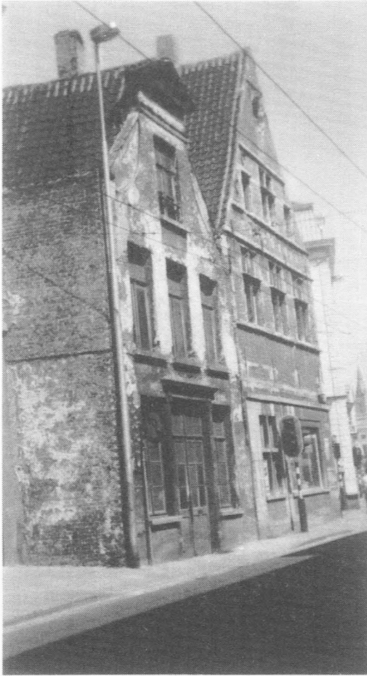
Fig. 30. Hoogstraat nr. 50 (met driehoekig fronton) en deel van Hoekhuis. Eigen foto, 1994.

toont. Twee daarvan, links op de foto, zijn later uit het straatbeeld verdwenen. En we gaan verder.