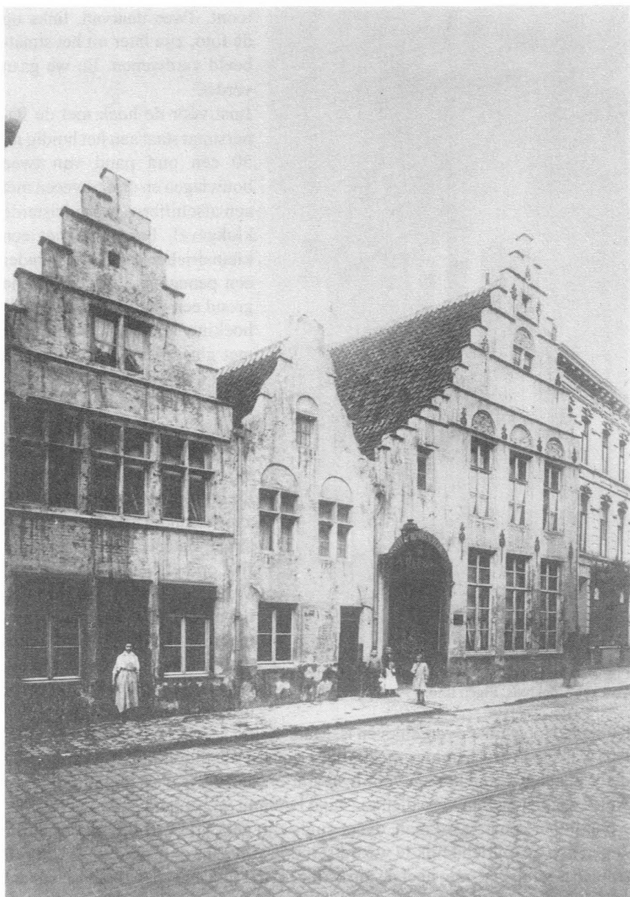
Fig. 29c. Hoogstraat, oude panden naast huis met huidig nr. 66, 1904.