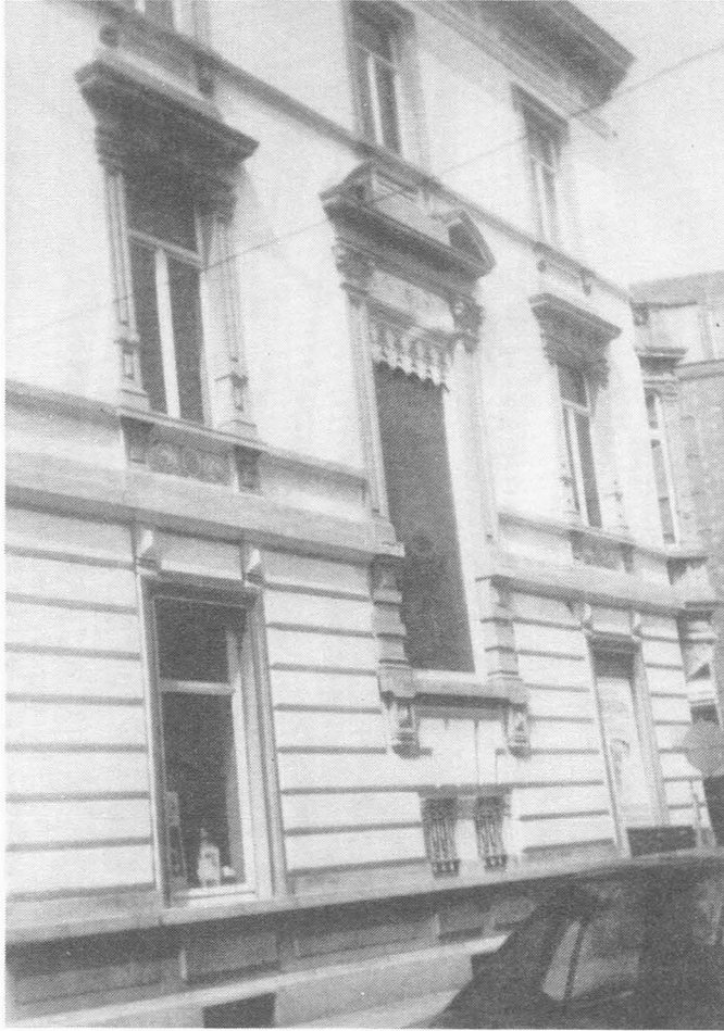
Fig. 22. Hoekhuis Hoogstraat-Rasphuisstraat (gevel kant Rasphuisstraat). november 1994.

De huizenrij, gelegen in het deel van de Hoogstraat voorbij de Rasphuisstraat, contrasteert, in haar geheel gezien, met wat we tot hiertoe hebben ontmoet. Men kan zeggen dat dit stuk - we kijken steeds naar de Zuidelijke straatwand - bouwkundig minder homogeniteit bezit. We treffen er kleinere naast grotere huizen, verschillende handelszaken waarvan de gevels ter hoogte van het gelijkvloers, door de ruimte die geschapen werd voor winkelpuien, soms harde en storende ingrepen hebben ondergaan. Sommige gevels zijn aan verval toe.