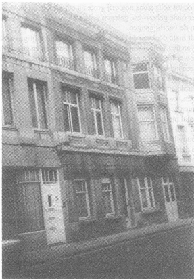
Fig. 27. Hoogstraat, panden; links deel van nr. 144, daarnaast nr. 142-134 met Art Decomotieven. Eigen foto, 1994.

mers oude, typische gebouwen. Aan de Westkant zien we oude stallingen. Aan de achterkant van de tuin (Noordzijde) en over de volle breedte ervan bevindt zich een zeer oud en groot gebouw van twee bouwlagen onder een hoog zadeldak met pannen.