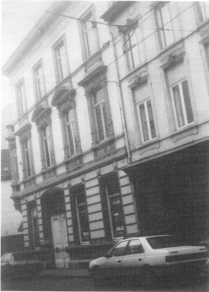
Fig. 21. Hoogstraat, hoekhuis Hoogstraat-Rasphuisstraat, nr. 71 (gevel kant Hoogstraat). Eigen foto, november 1994.

Een gebouw van een heel andere architectuur treffen we aan op de andere hoek (Westkant) van de Rasphuisstraat en van de Hoogstraat. Daar verrijst aan het nr. 71 een drie bouwlagen tellende monumentale en mooie herenwoning, daterend van het einde van de vorige eeuw, met een zeer fraaie, bepleisterde en beschilderde lijstgevel waarop een sterk uitgewerkte ornamentiek voorkomt. Aan de kant van de Hoogstraat zien we vier traveeën, een arduinen onderbouw, een grote poort, die net als de vensters op het gelijkvloers een arduinen omlijsting heeft, zie foto hierbij (Fig. 21). Op de hoektravee bevindt zich een