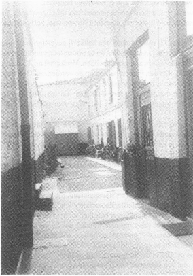
Fig. 23. Hoogstraat, nrs. 105-121, Beluik. Eigen foto, juli 1994.

tig wonen". Aan de muur, die achteraan het steegje afsluit, hangt een houten beeldje; een zittende Pan die op de herdersfluit speelt; "iets dat ze hier ooit op een oude zolder gevonden hebben", vertelde de jonge man me nog. Een mooi stukje. Toen ging hij weg en stond ik weer alleen. Ik bleef nog een wijle luisteren naar de stilte in het rustige beluik, buiten het lawaai en het geraas van het drukke verkeer in de Hoogstraat, waar het jachtig leven zijn gang gaat.