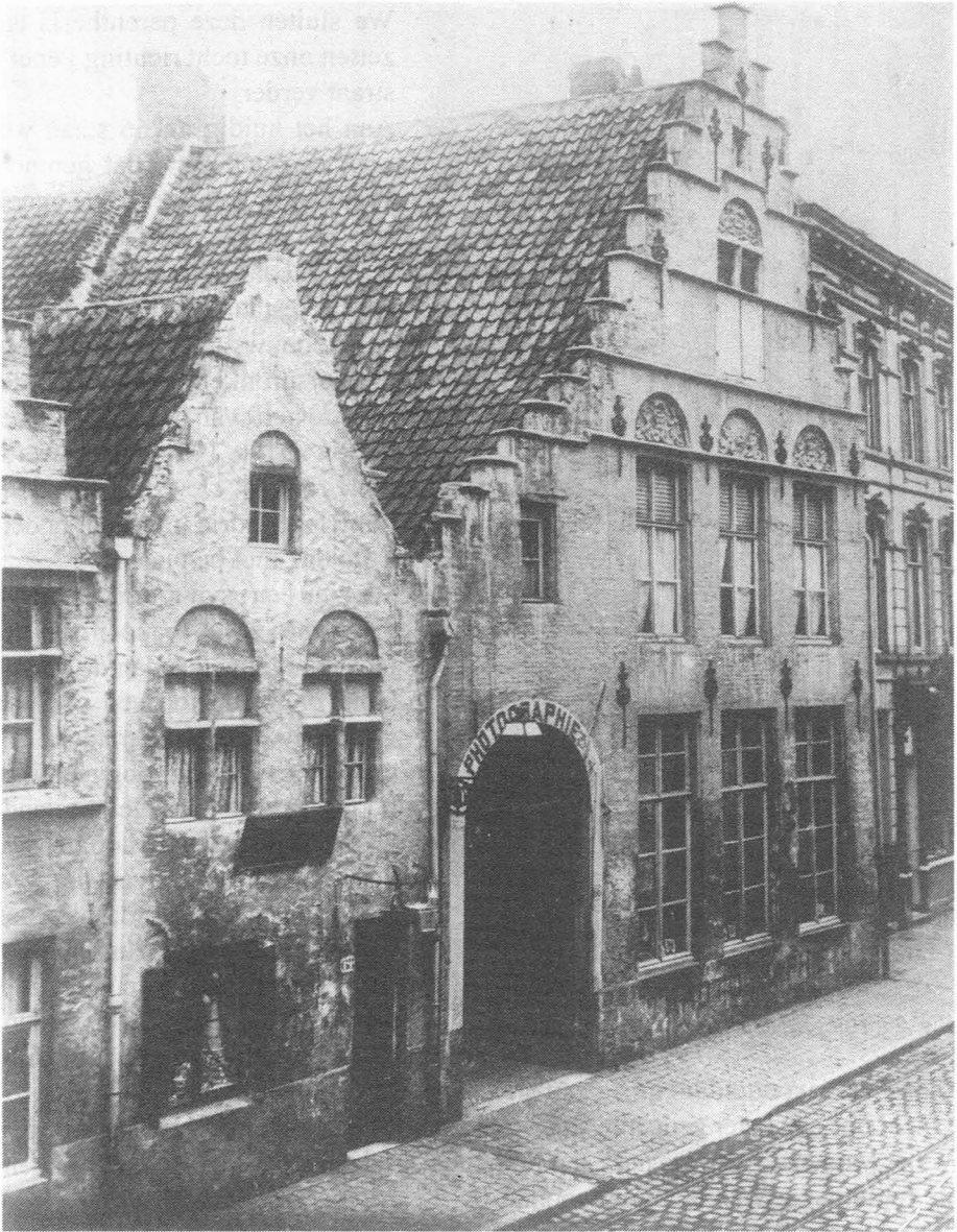
Fig. 29b. Hoogstraat (waar huidig nr. 66 staat), 1889 waar destijds de fotograaf J. Wante woonde. Stedel. Commissie voor Monum. en Stadsgez.