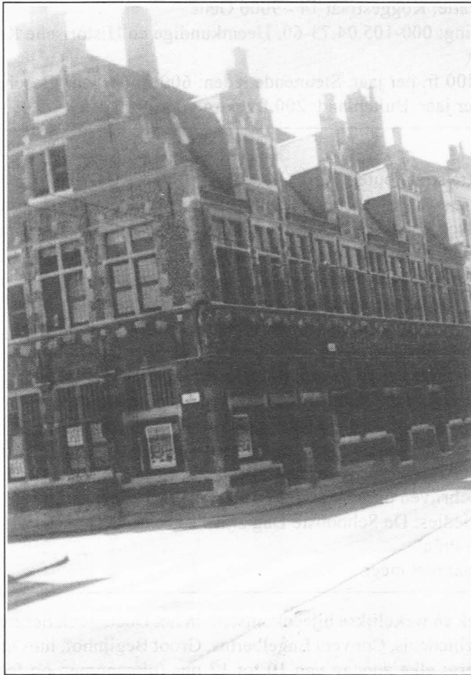
Fig. 16. Hoek Holstraat-Hoogstraat, Huizenrij nrs. 33, 35, 37. juli 1994.

Ook deze plaats en haar onmiddellijke omgeving hebben een lange en belangrijke geschiedenis achter de rug want het is aan de splitsing van Hoogstraat en Holstraat dat in de eerste helft van de 12de eeuw de "LEPROZERIJ", toegewijd aan de H. Maria werd opgericht, ook genoemd "LAZERIJ", LAZARUS-