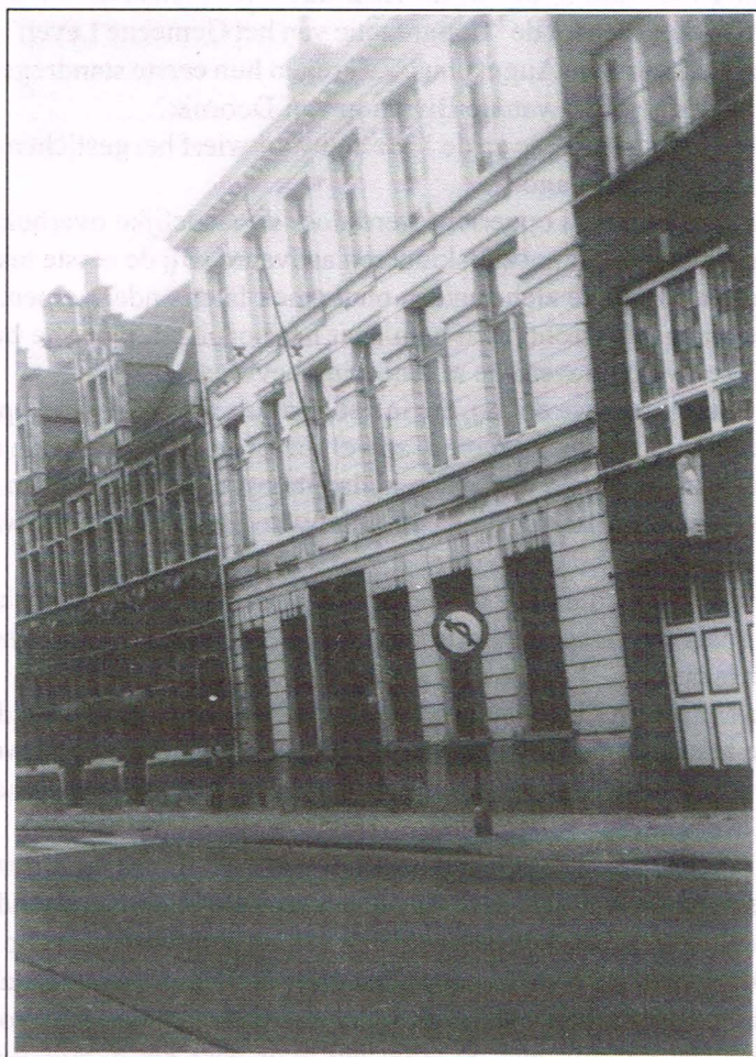
Fig. 18. Hoogstraat, pand nr. 39 (midden op de foto). Eigen foto, 1994.

Toen de vreselijke kwaal der melaatsheid, die reeds in de verste Oudheid bestond, zich in de loop der eeuwen ook in onze gewesten steeds maar verder uitbreidde, ontstonden op heel wat plaatsen "Leprozerijen". In Brugge was er