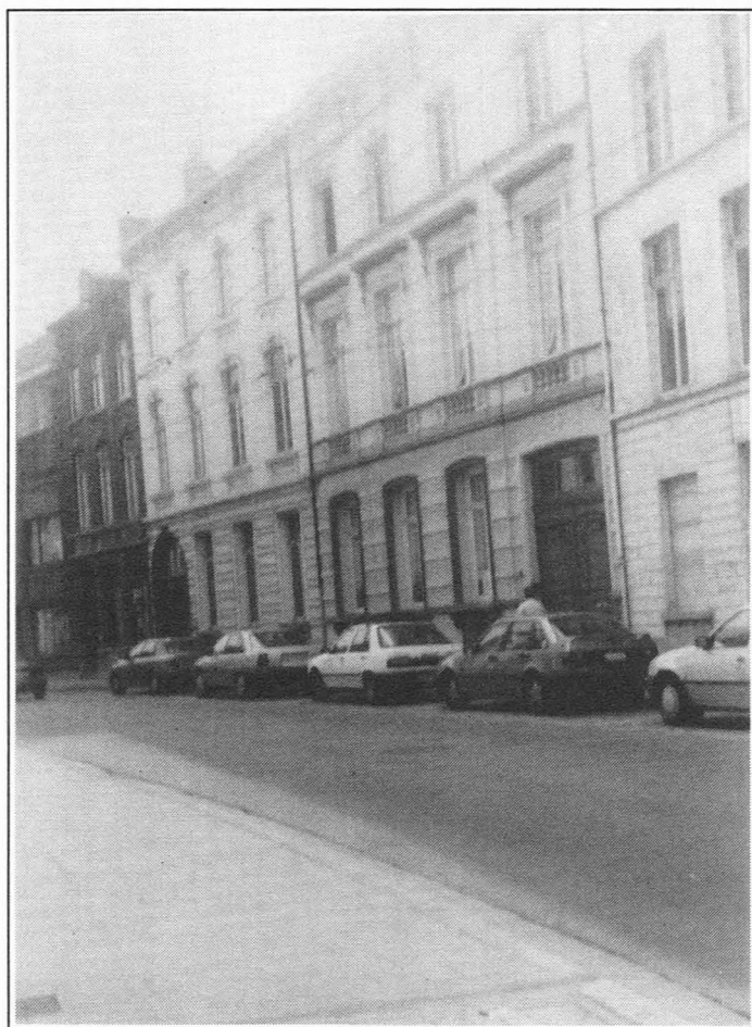
Fig. 20. Hoogstraat, huizen met de nrs. 47 en 49 (midden), links nr. 45 en rechts deel van nr. 51. Eigen foto 1994.

Vorbij de ingang van het Dominicanenklooster, Hoogstraat nr. 41, en verder gaande richting Rasphuisstraat, zien we een aantal hoofdzakelijk 19de-eeuwse