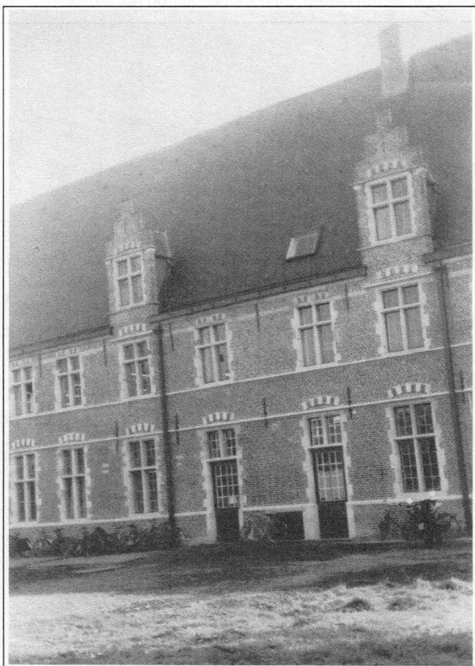
Fig. 19c. Zicht op het Dominicanenklooster langs ingang Rasphuisstraat. Eigen foto, oktober 1994.

Predikheren in 1228 hun klooster stichtten. De kerk aldaar werd opgericht omstreeks 1240 en boven de kloostergang werd in het jaar 1473, dank zij de vrijgevigheid van Margareta van York, de bibliotheek gebouwd. Ze bevatte een unieke verzameling boeken en middeleeuwse handschriften die echter uitermate zwaar te lijden had onder de beeldenstorm van 1566, waarover Marcus van Vaernewyck in zijn "Beroerlicke Tijden" een onthutsend verhaal bracht. Van de oorspronkelijke verzameling bleef weinig gespaard. Toch gaat het om een zeer kostbare collectie want later kwamen nog een aantal middeleeuwse stukken en handschriften de verzameling aanvullen. Het is een prijzenswaardig en gelukkig initiatief te noemen dat deze bibliotheek haar oude en historische locatie heeft teruggevonden. Het meubilair kwam mee. Langs de kant van de Hoogstraat zijn de oude kloostergebouwen aan het oog