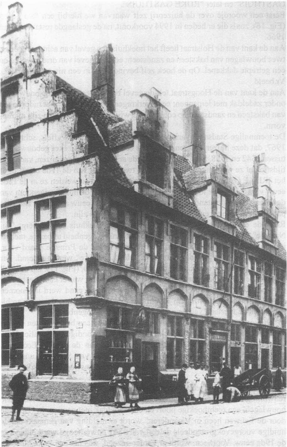
Fig. 17. Hoek Holstraat-Hoogstraat, Huizenrij nrs. 33, 35, 37; einde vorige eeuw-begin deze eeuw.