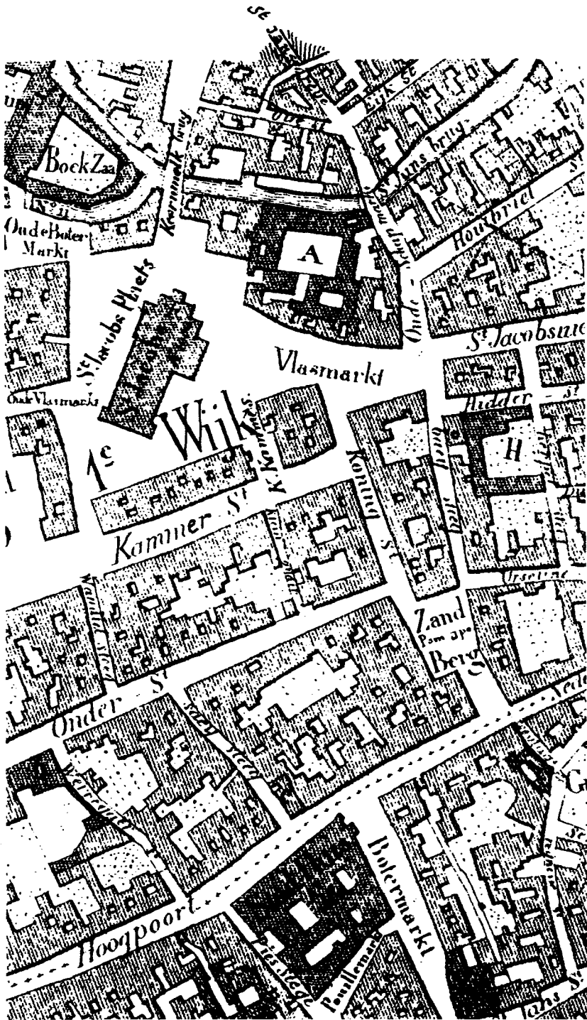
Vergroot fragment van de plattegrond van Gent van A.J. Saurel (1841). A = Vondelingenhuis.