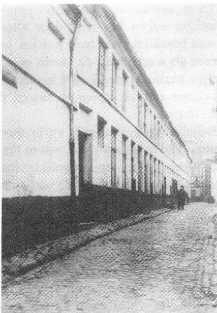
Zicht op de huisjes die met hun rug tegen de danszaal stonden en waar later Garage Peugeot kwam (1934).