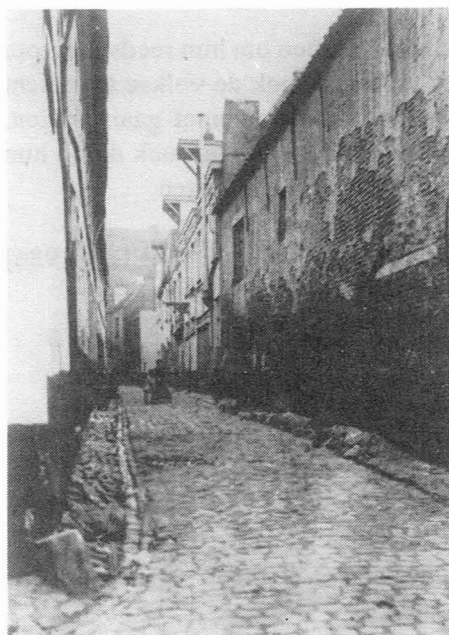
Achterhuizen van de Nederkouter (1934).