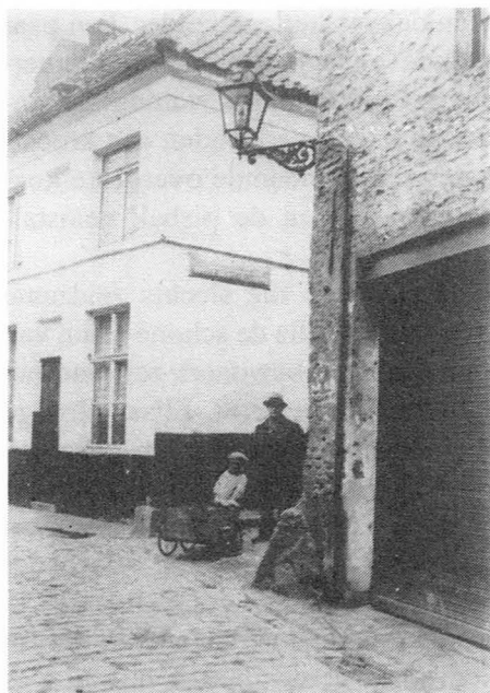
De St.-Elisabethsteeg, nu de St.-Liesbetsteeg, gezien vanuit de Jeruzalemstraat, kant Nederkouter (1934).