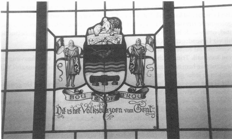
Glasraam in het Stadhuis.