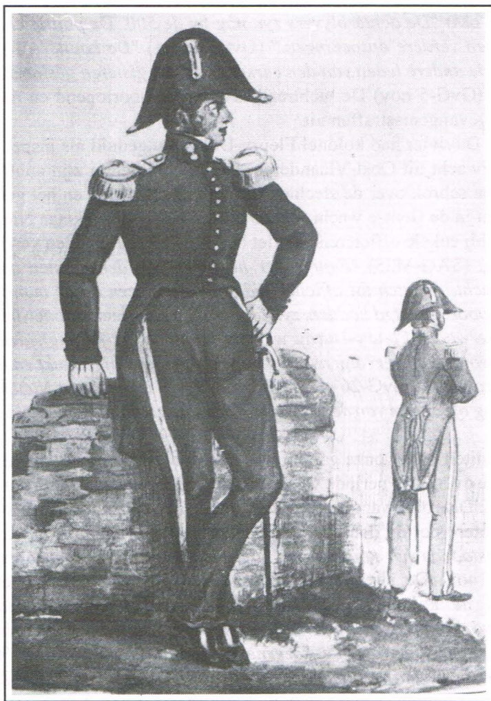
Afb. 4. Kleine tenue van officier 1833. Schilderij Kon. Legermuseum.

Het was te verwachten dat de officieren van de civique wacht niet lang de roemvolle blauwe boerekiel zouden dragen. (10) Stel u simpel een select gezelschap in avondkledij voor, waartussen baron X en graaf Y als burgerwacht-bevelhebber in boeredracht; zowel toen als nu ondenkbaar. Het Besluit van 6 februari 1832 voorzag dan ook een "kleyne tenue" voor officieren, te dragen buiten dienst. (11) "Donker blaewen rok, met ééne reeks van negen knoopen; gelyken kraeg, van vooren open met zilveren granade of jagthooren op rood laeken geborduurd; puntwys gesnedene omslaegen met twee knoopen; breede en afgeronde slippen... zilveren knoopen met den Bel-