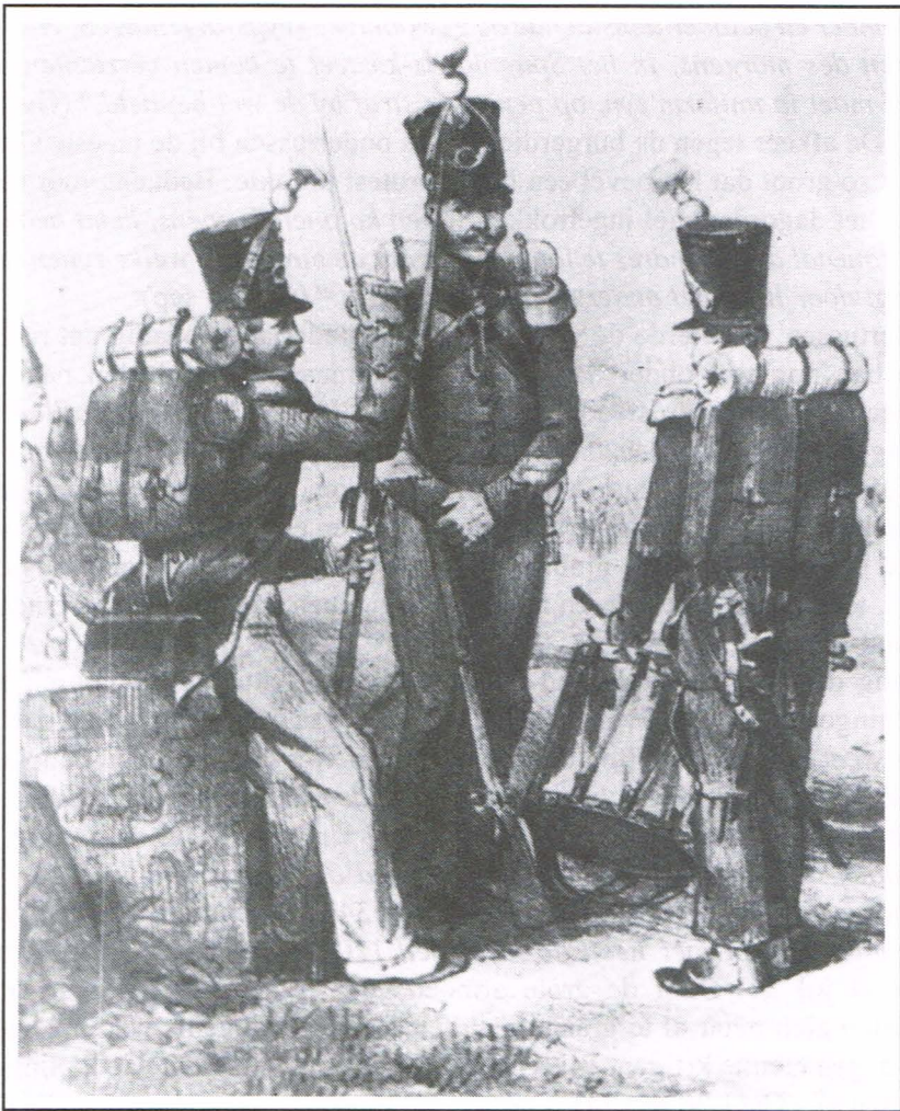
Afb. 7. 1ste Ban in marskledij 1835. Schilderij Kon. Legermuseum.

blauwe kiel niet voldeed, wat er ook van zij, de koning besloot op 4 februari 1835 de garde te voorzien van een splinternieuw uniform. (15) "Kleed lang, konings-blauw, regt toegeknopt op de borst met negen witte metalen knoppen, blauewen uytgesneden kraeg met rood boordsel; ronde omslagen met rood boordsel, drypuntige pandslip in jonkilie geel (geel-wit, sic) met blaew boordsel met dry kleyne knoppen... Schouderlinten in rooden grond op voeyering in blaew laken; epauletten in roode wol met blaew gevoederd... witte metalen knoppen een weynig boogs, houdende eenen leeuw in 't midden, en rondom het randschrift Burgerwacht van België... Broek van gryns marenngo laken, rood boordsel... vallende op de leers... Halsboord van zwart laken... Shako van zwarte vilt, 220 mm hoog..." (Afb. 7)