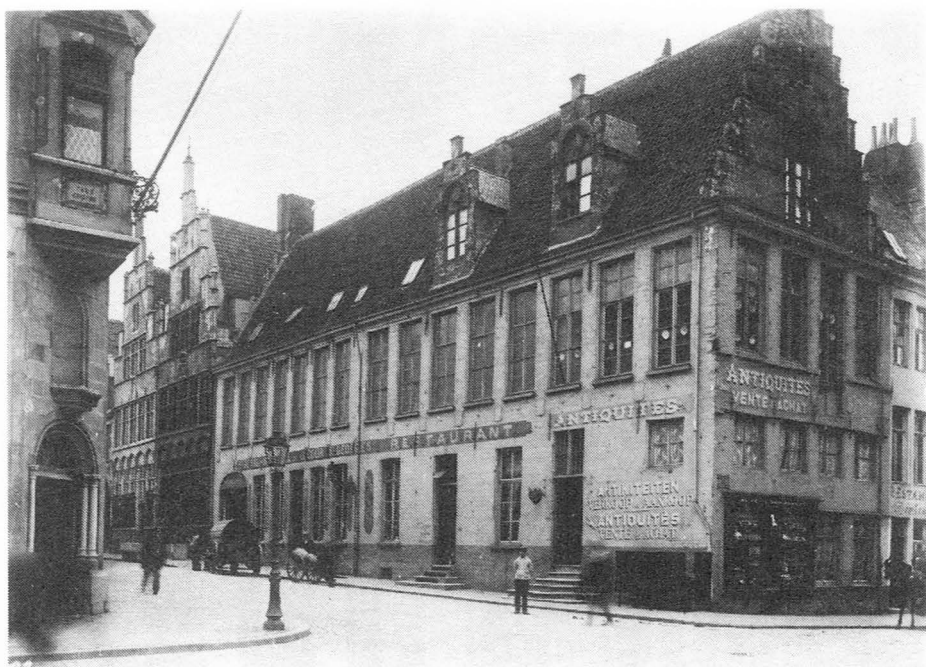
Het St-Jorishof in het begin van deze eeuw.