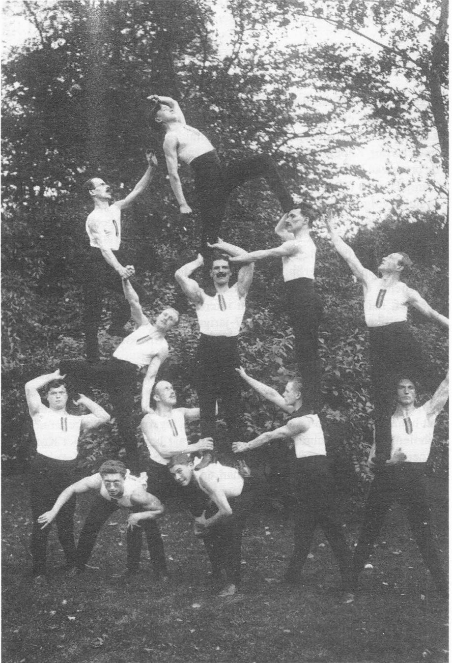
1913 - De assymetrische pyramide was een originele en sterke oefening waarmee Ganda reeds vroeg naar buiten trad.