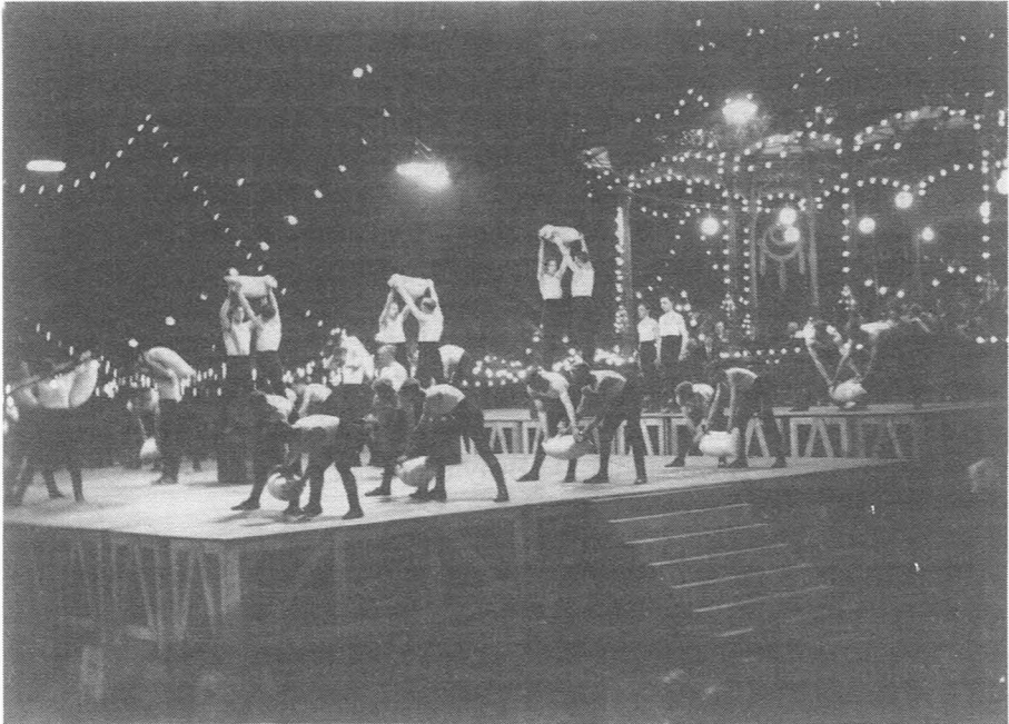
Ganda-optreden bij de 11 juliviering op de Kouter te Gent op 10 juli 1932.