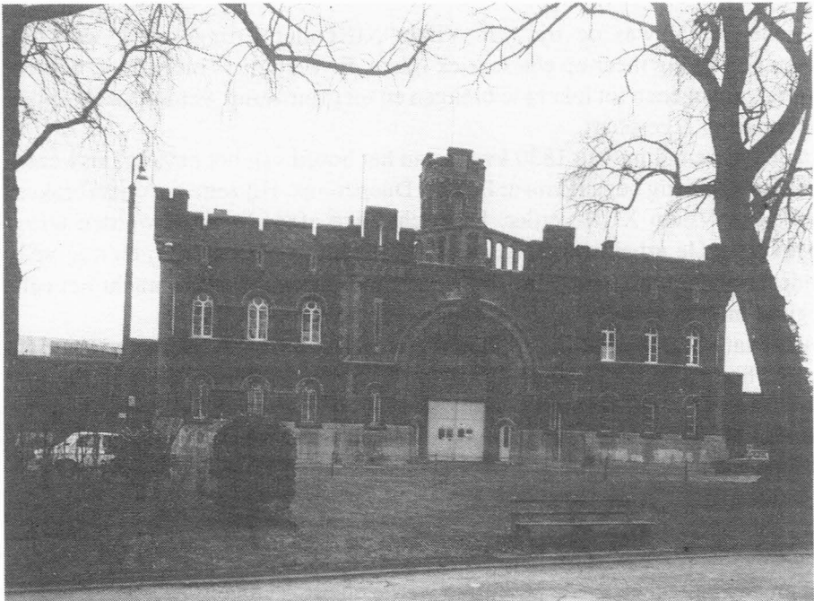
Gevangenis op de Nieuwe Wandeling.

Dit kwartier werd de 30 juni 1887 ontruimd en een rondschrijven van 6 juli