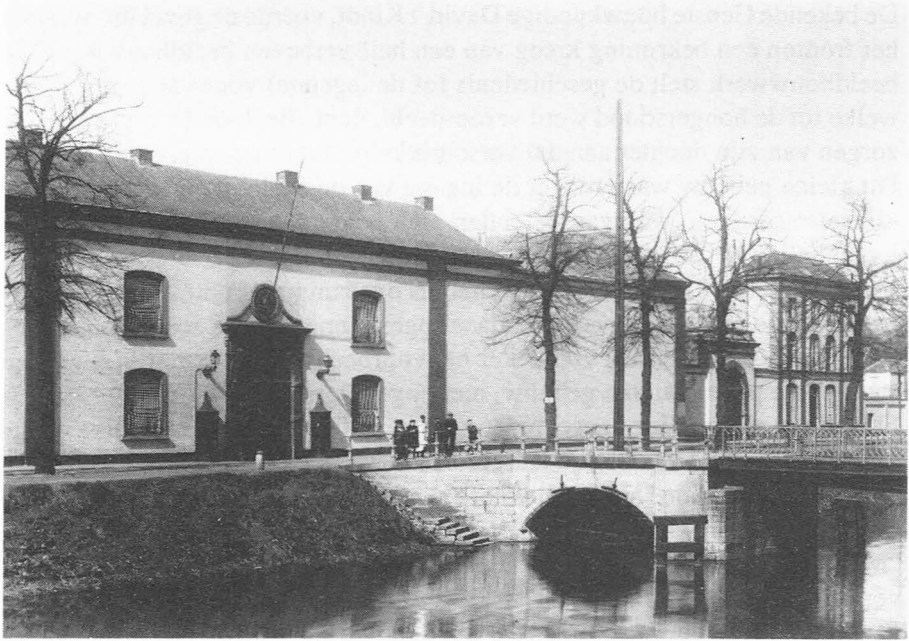
Ingang van het Rasphuis op de Coupure. Foto Nr. 25965.

waren een groot aantal kamers, waardoor het mogelijk was de gedetineerden van elkander te scheiden. De gevangenen waren niet alleen landlopers, maar ook grote misdadigers, vrouwen en kinderen werden er als straf opgesloten. Werklozen met een behoorlijk gedrag, kregen er vrijwillig toegang als ze een onderkomen zochten.