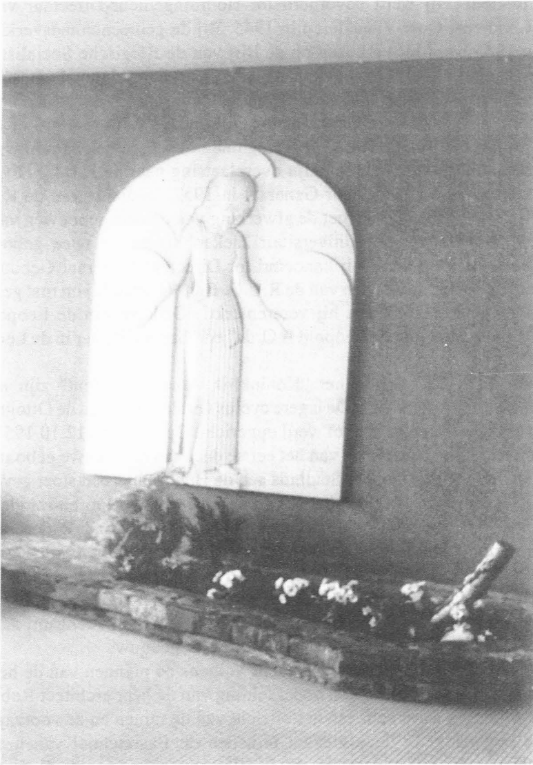
Gedenkplaat ter herinnering aan de slachtoffers van de Tweede Wereldoorlog.

In 1988 werd een kleuterafdeling opgericht. In 1957 had de school 620 leerlingen. Op 15.1.1991 werden er 1.652 leerlingen geteld. Oorspronkelijk ontstaan als "Atheneum voor jongens", herbergen de gebouwen heden een gehele cyclus van scholen, toegankelijk voor jongens en meisjes! Zij behoren allen tot het Gemeenschapsonderwijs.