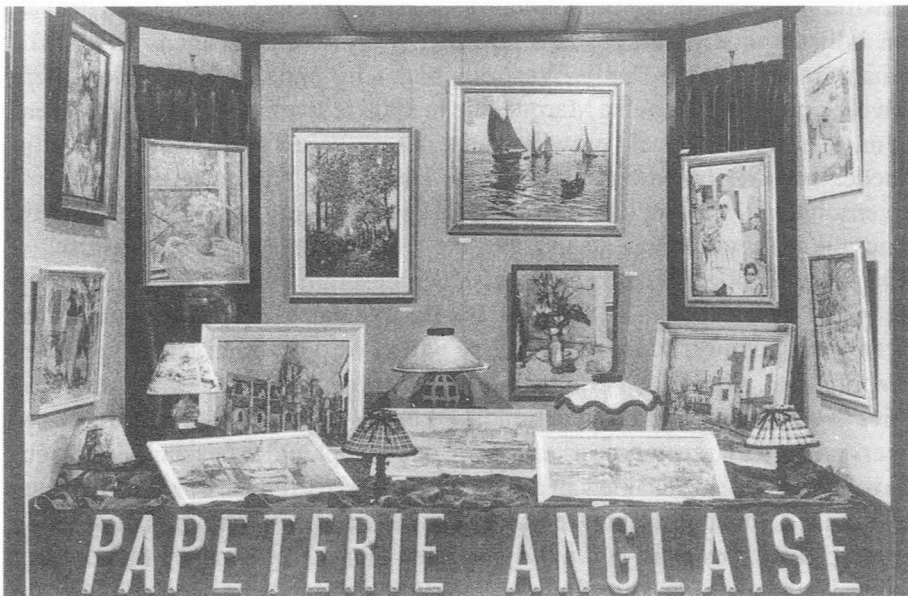
Fig. 5. Uitstalraam uit de jaren twintig of dertig.

(met een gleufje voor de pen). Aangezien die vrouw heel waarschijnlijk amper kon schrijven of misschien zelfs analfabeet was, werd er verondersteld dat zij door een of andere notaris, schoolmeester of pastoor uit haar dorp gestuurd werd. Na ettelijke maanden wekte de hoeveelheid gekochte inkt toch enige verwondering op. Ondervraagd, antwoordde het boerinneke heel gewoon dat zij, om een mooie kleur te bekomen, rode inkt voegde bij de boter die zij op de markt kwam verkopen! Ik kan onmogelijk alle tafereeltjes vertellen waarop wij "vergast" werden. Meestal werden die koddige of nare voorvallen 's middags of 's avonds aan tafel medegedeeld en nagepraat.