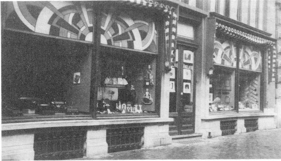
Fig. 6. Gevel in juni 1945. De stijl van de versieringen en opschriften evolueert zonder dat er structurele veranderingen aangebracht worden.

moedig aan het kind hoorde zeggen : "... en ge moogt kiezen wat ge wilt", dan voelde men aanstonds zijn buik grollen van honger en spanning, want dat was het teken dat het heel lang ging duren. Wanneer het kindervingertje beslist en vlug op een van de modellen geduwd werd, weerklonk de stem van een der ouders : "Ah neen, dat toch niet!". Na een uur "kiezen wat het wilde" werd het kind door de ouders naar buiten meegesleurd met de afgrijselijke melding : "We zullen eens terugkomen...". Anderzijds, waren er mensen die zomaar eens binnenwipten om vriendelijk goeiendag te zeggen of om even uit te blazen. Iemand die alzo geregeld "passeerde" was onze betreunde voorzitter Gaston Hebbelynck, steeds op zoek naar een inlichting of een documentje.