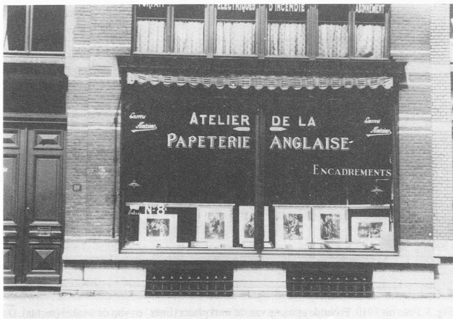
Fig. 4. De werkplaats van de Papeterie Anglaise met reclames voor "Perry" pennen en "Antoine" inkt. Bovenaan, reclame van de Société Anonyme de Téléphonie Privée. Op een andere, hier niet afgebeelde foto kan men lezen : "Installations à forfait - Téléphones - Sonneries et horloges électriques - Avertisseurs de vol et d'incendie - Lignes privées - Installations par abonnement". Op nog een andere foto, die hier om technische redenen moeilijk te reproduceren was, kan men links van de deur een bord ontcijferen : "...ericain consulate - ... hours - a.m., 2 to 4 p.m.". Blijkbaar de spreekuren van het Amerikaans consulaat dat op een verdieping moest gevestigd geweest zijn.

strenge (en zij was het ook) dame uitzag, kon zij haar mouwen oprollen wanneer nodig. Een klein voorbeeld. De eigenaars van een tegelfabriek waren haar een som geld schuldig en bleven het vereffenen uitstellen, vermoedelijk hopen dat zij het sturen van herinneringsbrieven beu zou worden. Op zekere dag was zij het inderdaad beu, maar loste het op een eerder verrassende wijze op. Zij ging met een bediende een "steekkeire" huren, reed naar het bedrijf van haar schuldenaars, vulde er de kar vol met tegels tot de waarde van de schuld bereikt was, en reed door het stadscentrum weg voor de ogen van de machteloze fabrikanten en voor die van de uitermate verwonderde "burgers"... Dat zij wist wat zij wou blijkt ook uit het volgende, onbelangrijk maar koddig feit. Haar eerste schrijfmachine was een "Smith Premier" (die hebben wij nog). Zij had echter nooit leren typen en wou per se dat de letters opgesteld waren in overeenstemming met haar eigen mentale schema. D.w.z. dat men speciaal voor haar een klavier heeft samengesteld, met iedere letter daar waar zij het wou!