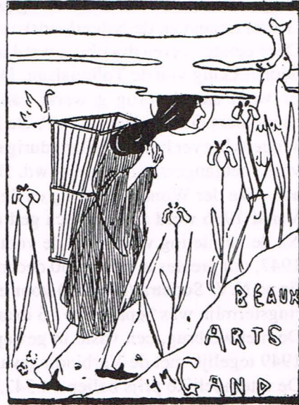
Fig. 5. Spotprent in "Le Petit Bleu" van 6 september 1895.

De volgende triënnale, die pas in 1899 plaatsvond, was weer op oude leest geschoeid. De aanvaardingscommissie voor schilderkunst werd tot tien leden herleid. Enkel Alexandre Struys overleefde 1895! Het aantal tentoongestelde kunstwerken steeg tot 1.194.