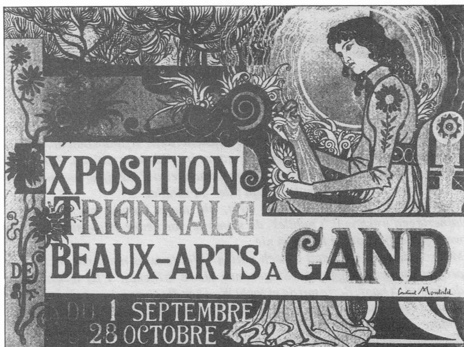
Fig. 3. Affiche ontworpen door Constant Montald. Lithografie, 59,0 cm x 76,5 cm. Druk N. Heins, Gent.

deze jury streng maar eerlijk te zijn : "... sa décision de reléguer à l'étage les oeuvres marquées du n° 3 a été l'objet de vives réclamations, bien qu'à première vue les oeuvres groupées là haut, dans le "salon des réprouvés", forment un ensemble qui justifie le classement effectué."