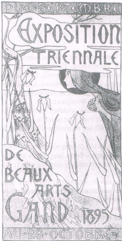
Fig. 4. Voorkaart van de catalogoog ontworpen door Julius De Praetere. Lithografie, 14,0 cm x 6,9 cm. Druk N. Heins, Gent.