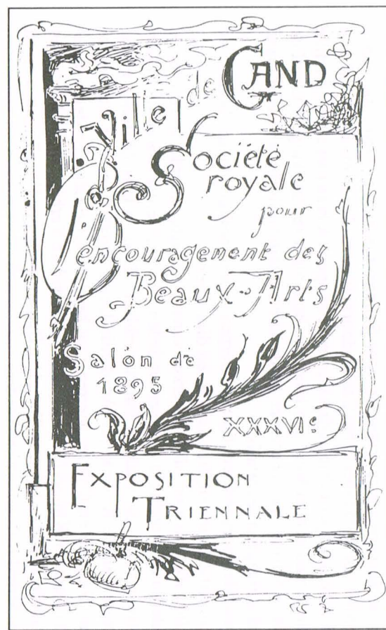
Fig. 2. Frontispice (?). Ontwerp door Armand Heins. Bijgekleurd in groene waterverf.