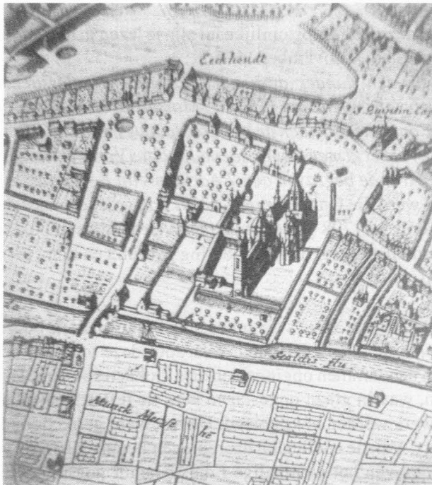
Fragment van de plattegrond van Gent in Ant. Sanderus. Verheerlijkt Vlaandre . Leyden, Rotterdam, 's Gravenhage. 1735. Dl. I, tegenover p. 124. Anastatische herdruk. Handzame, 1968. 5. O.L.Vr. kerk; 7. Abdijkerk van Sint-Pieters.