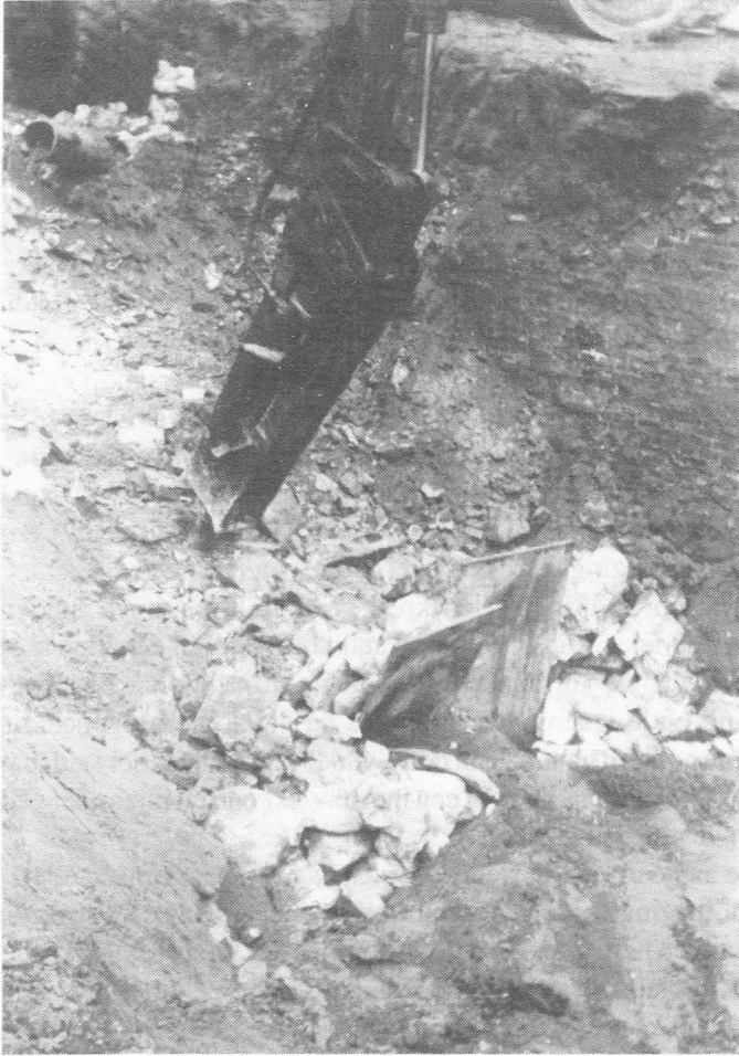
Fig. 2. Men moest speciaal materiaal aanwenden om de massieve fundering van de Torrepoort klein te krijgen - 1988.

haar functie in het verdedigingsstelsel verloren had.