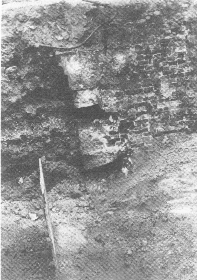
Fig. 3. Poel, naast de overblijfselen van de funderingen van de Torrepoort : een deel van een muurconstructie in rode baksteen met een opgaand stuk in blauwe hardsteen.

had naar de Houtlei en naar de Holstraat, in de Stadsrekening en in andere bescheiden aangeduid onder verschillende benamingen. Het is Fr. De Potter, die er aan enkele herinnert : "Coyers steghe" 1339-1340; "Koysteghe" 1414-1415; "Coeyestrade" 1456-1457; "Koestege" 1524; "Mirakelstrate" 1502-1503; "Rakestraetkin" 1530; "Cruepelsteghe of Cruepelsteexken" 1600-1601; "Vuulsteghe" tot zelfs "den Zeerdsac" en nogal plastisch uitgedrukt... "den Contentast" 1484-1485; en ook nog "Couversteghe". Het was daar een echte doolhof van steegjes en eindjes van stegen. In het begin van de 15de eeuw werd het Pensstraatje aan één kant afgesloten.