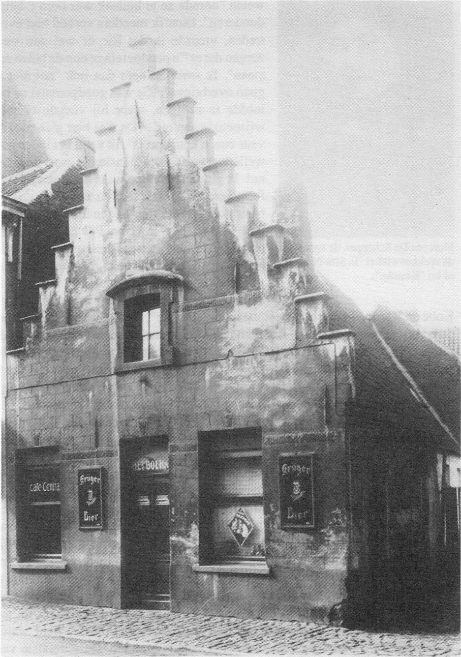
Café "Het Boerke".