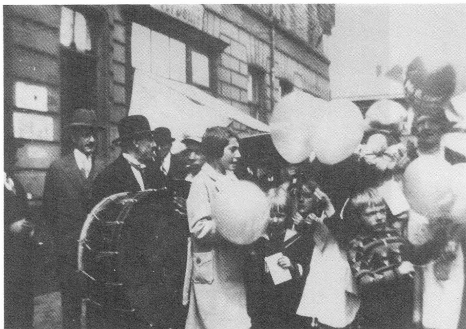
Zo vierde men feest op de Muide.