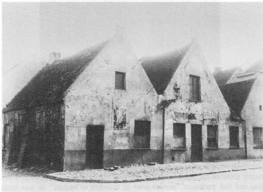
Het verdwenen huizenblok aan de Muidepoort tussen Roer- en Maststraat (nu Zaamslagstraat). Het huis uiterst rechts was "Het Meuleken". Het linker hoekhuis heeft nog een tijdje een bibliotheek van het Willemsfonds geherbergd.