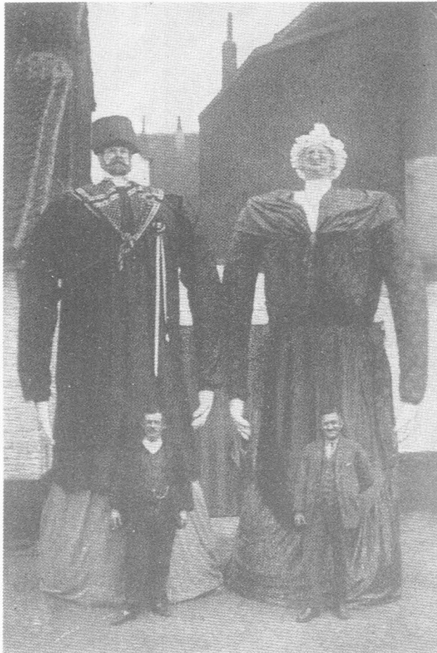
Gebuurtekring Muidebrug en Ringspoorweg - Gent 1929 Onze Reuzen KOBE & KATRIEN