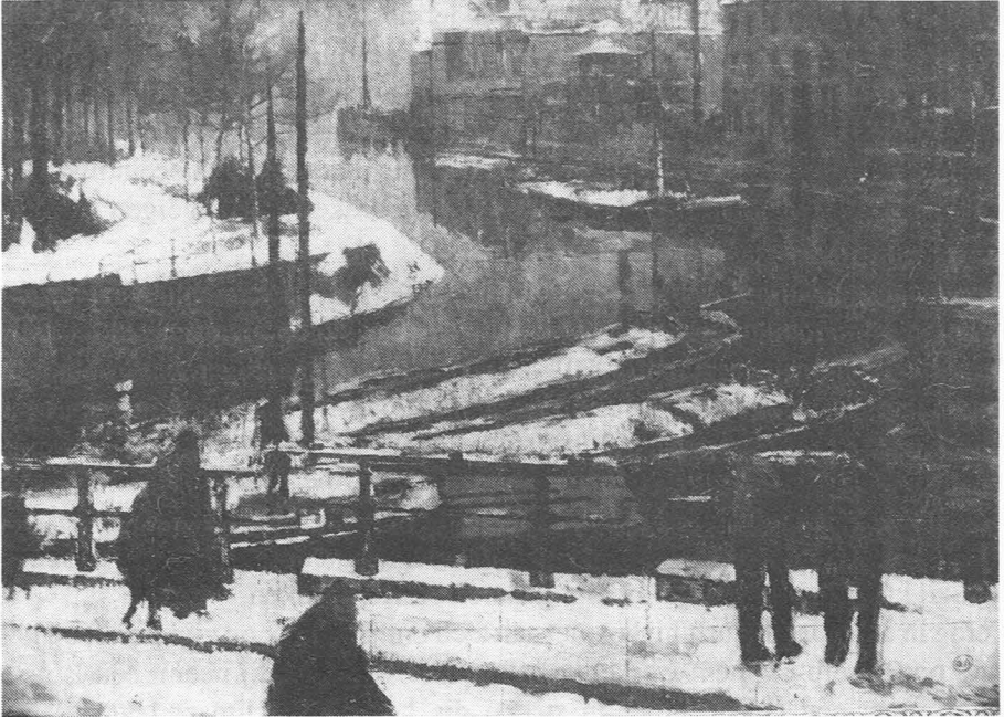
Dooi te Gent. (1e ontwerp) Copyright A.C.L. Foto B 44308.

en gevels opgezogen in de natte hemel, het exakte beeld van die machtige, stoere stad die in zijn gebouwen, kerken en Stenen, nooit een glimlach heeft geprent omdat zij enkel maar van strijd en macht droomde, het exakt beeld van een stad zonder artistiek kantwerk maar die U aangrijpt en betovert.