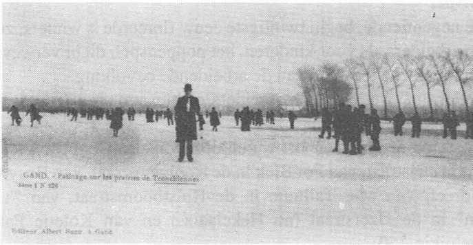
Foto 51. Ijspret op de Drongensemeersen ca. 1900.