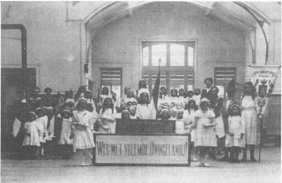
Foto 48. Binnenzicht Stedelijke Meisjesschool Drongensesteenweg ca. 1920 (Verz. Fr. Van Bost, Gent).