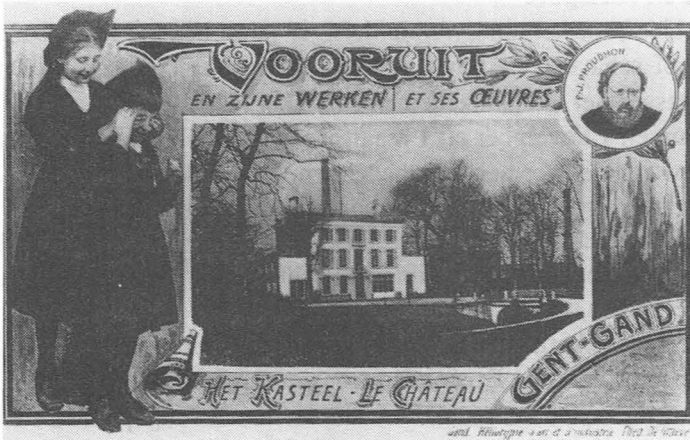
Foto 52. Het "Kasteeltje van Vooruit" bij de Groendreef.