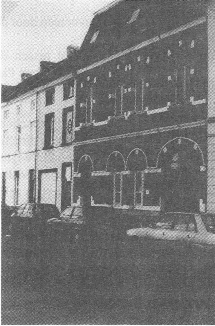
Foto 45. Stedelijke Jongensschool Geitstraat.