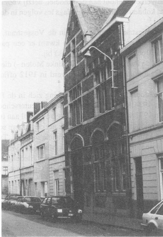
Foto 47. Stedelijke Jongensschool Acaciastraat.