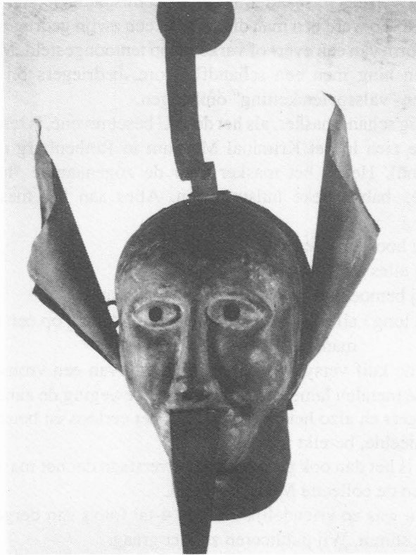
Foto 2. Schandmasker voor vrouwen met bel. Bij de minste beweging van de veroordeelde werd de aandacht van het publiek getrokken door het klingelen van de bel.