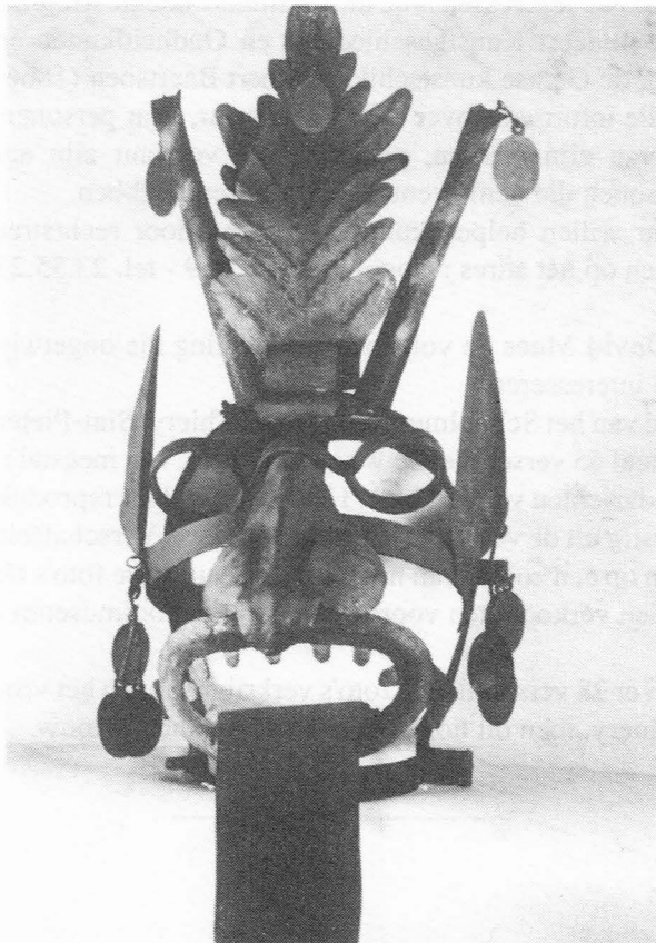
Foto 4 : Een analoog masker als hetgene in Ghendtsche Tydinghen vermeld is.