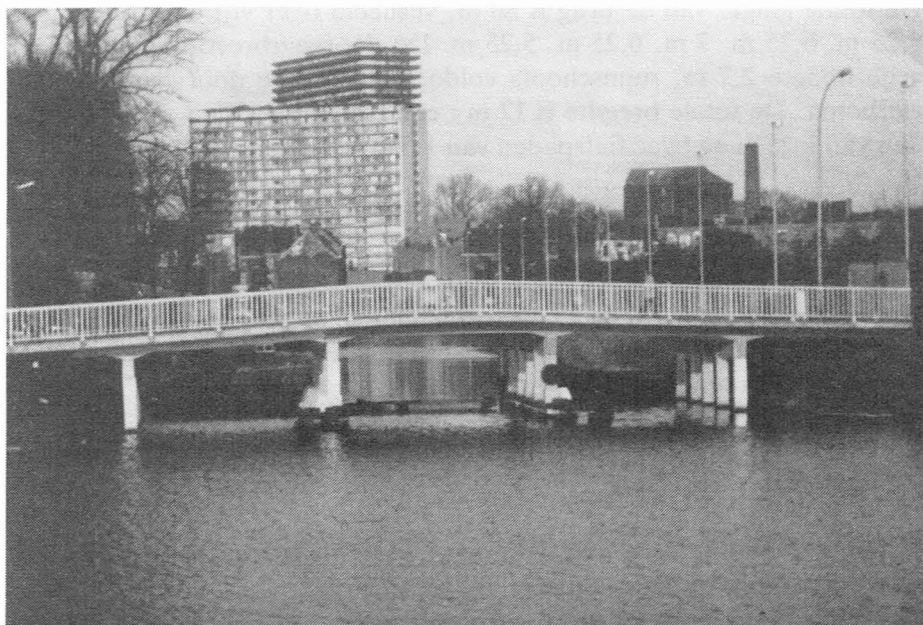
Deze brug kreeg haar naam van de nabijgelegen St.-Martinuskerk, in de volksmond Ekkergerkerk genoemd.