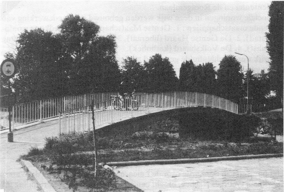
De huidige Malembrug, bouwjaar 1971, foto 1983.