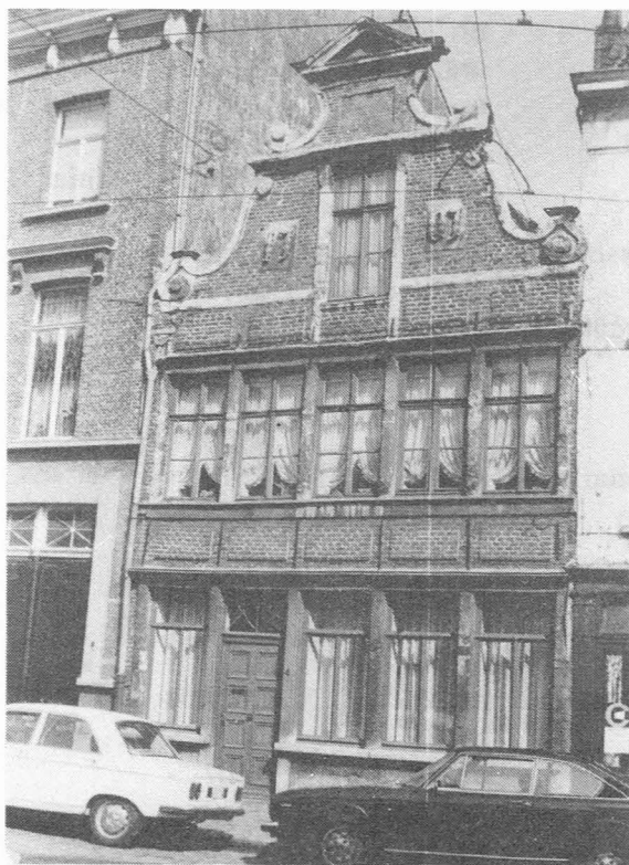
Lange Steenstraat 4 - Bouwdatum 1707 (Huis Goetghebuer).