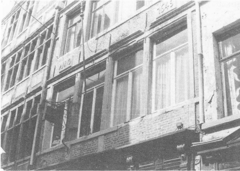
Jan Breydelstraat 36 - Bouwdatum 1645