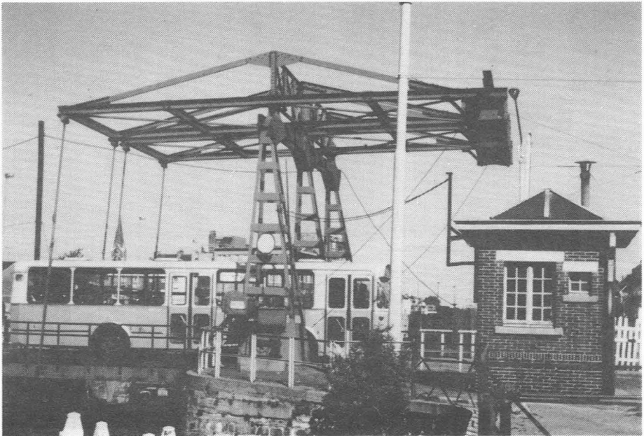
De "noodbruggen" van 1947 anno 1982.