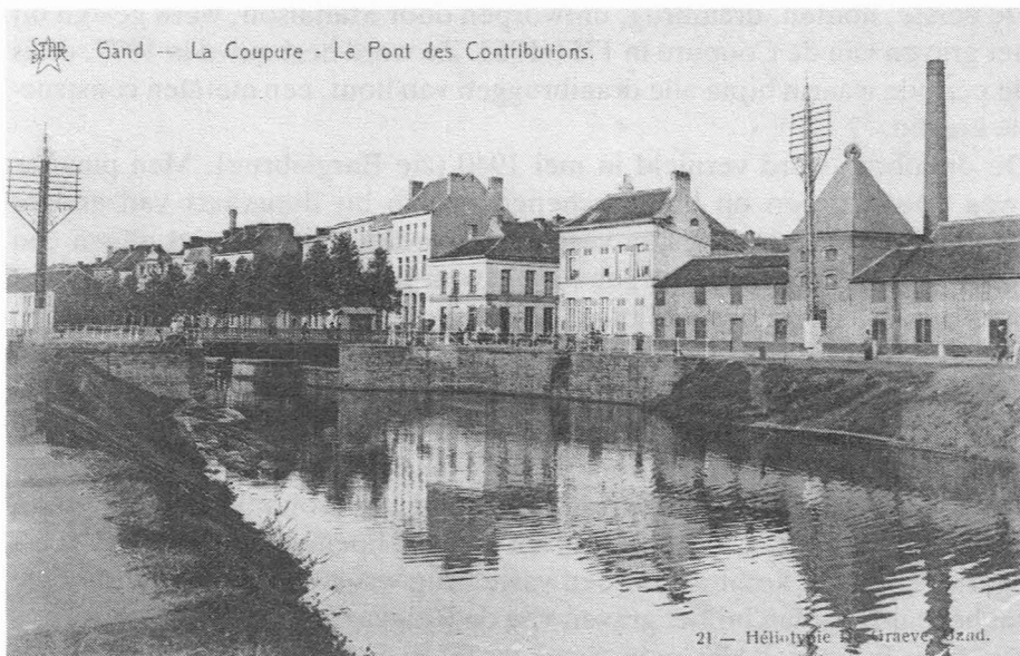
De Contributiebrug vóór 1940.