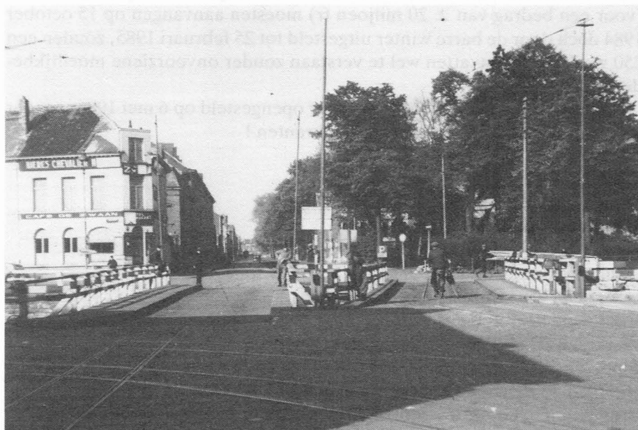
De Contributiebrug tijdens de oorlog 1940-1945.