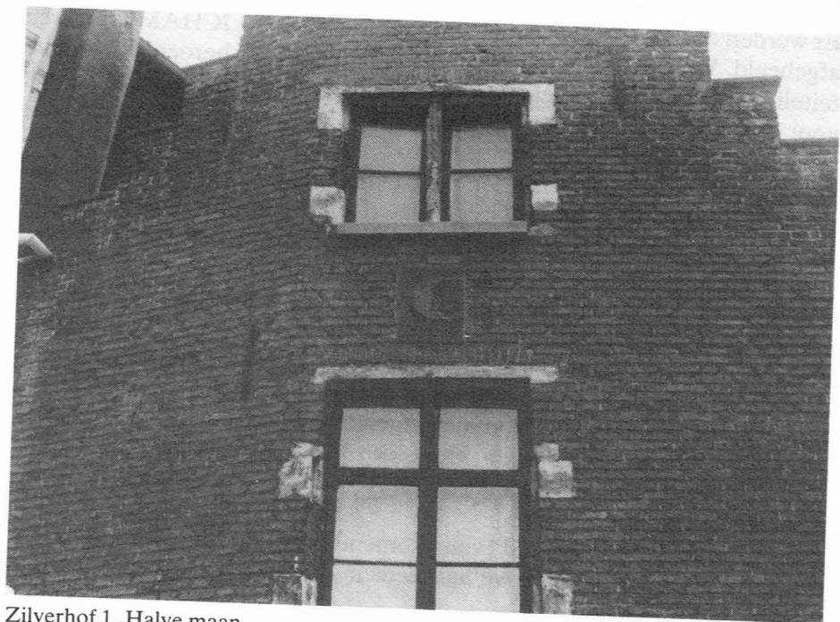
Zilverhof 1. Halve maan.