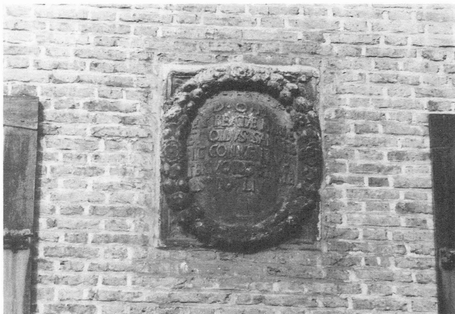
Sofie van Ackenstraat 3. Tekstgevelsteen.