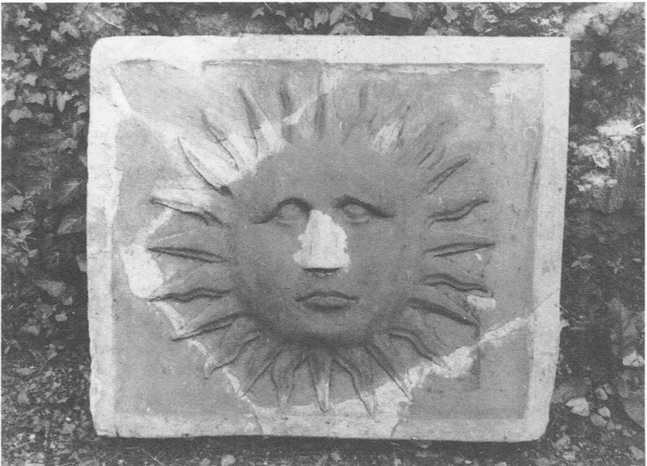
Gents Museum voor Stenen Voorwerpen. De Zon.