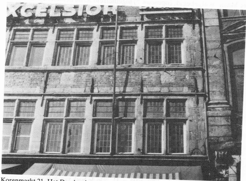
Korenmarkt 21. Het Damberd.