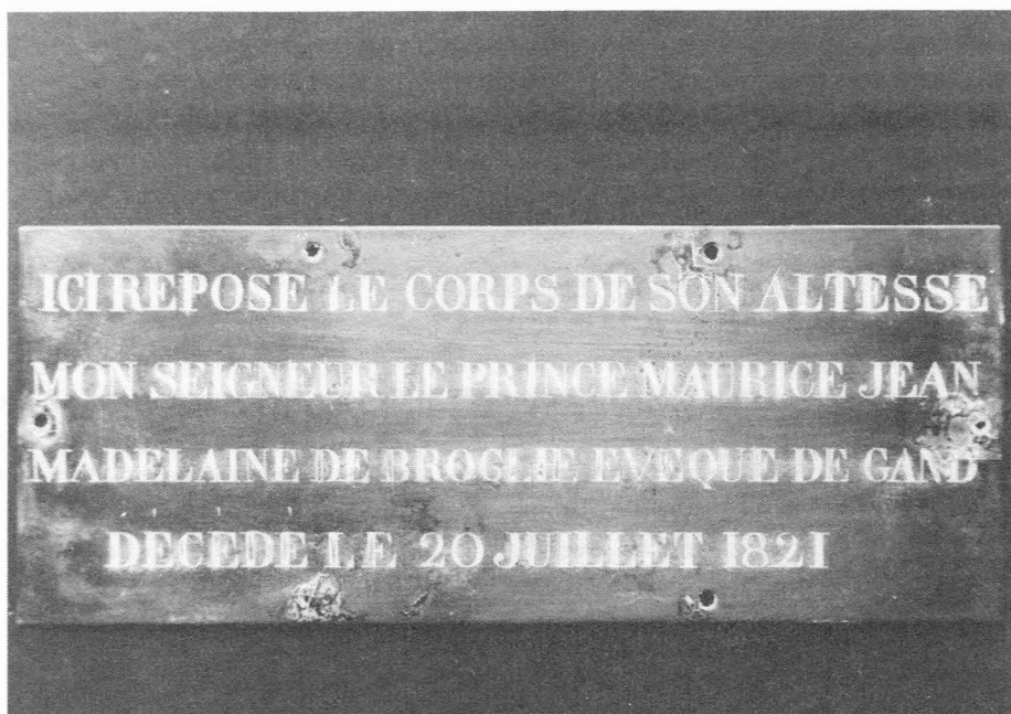
Koperen plaat uit het graf van Mgr. de Broglie in de crypte van Sint-Baafs.